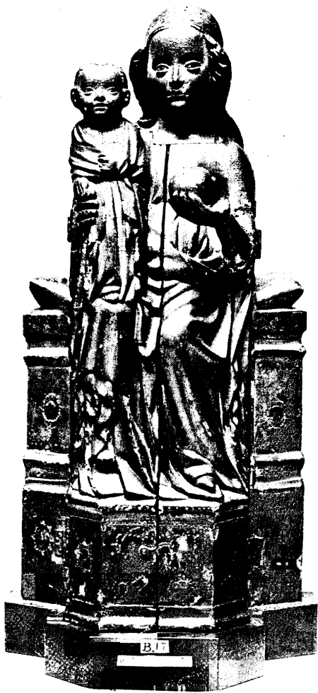
Abb. 5. Schreinmadonna, Westpreußen, gegen 1400. Paris, Cluny-Museum (geschlossen)