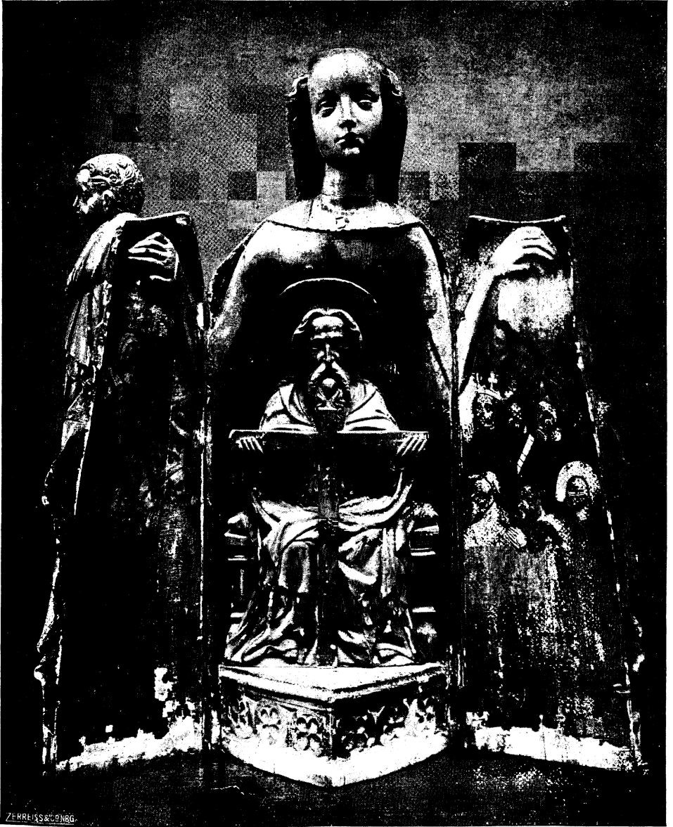
Abb. 2. Schreinmadonna, Westpreußen, um 1390. Nürnberg, Germanisches Museum. Geöffneter Zustand.