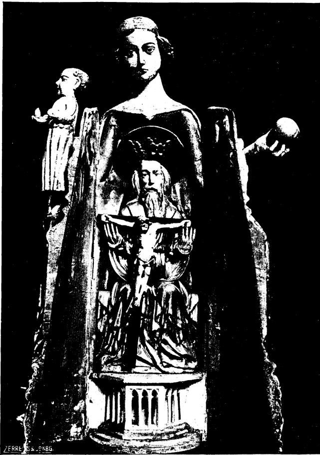
Abb. 10. Schreinmadonna in der Kirche zu Liebschau, Anf. d. 15. Jhrh. (geöffnet)

Rechten eine Frucht, auch hat es keinen Mantel, so daß die Einbettung seines linken Armes in den Faltensack fehlt. Vor allem aber kommt als neues Motiv hinzu, daß statt des prismatischen Sockels die von gotischem Gewölk umschlossene Sichel des zunehmenden Mondes, dessen Gesicht von vorne sichtbar wird, auftritt.