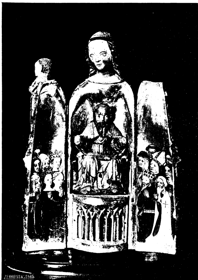
Abb. 8. Schreinmadonna in der Kirche von Klonowken, um 1400 (geöffnet)

Das zweite der an Ort und Stelle gebliebenen Exemplare aus der Gruppe der Deutsch-Ordens-Schreinmadonnen befindet sich in Klonowken (seit 1919 polnisch), ehemals Kreis Preußisch-Stargard, Westpr. 29)