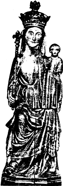
Abb. 17: geschlossener Zustand der Schreinmadonna

der Kopf der Madonna gespalten! Ihr Inneres ist nicht im alten Zustand auf uns gekommen; doch geht aus einer Beschreibung des 17. Jahrhunderts hervor, daß sie ehemals Szenen der Geschichte Christi bis zum Jüngsten Gericht barg. Wichtig ist, daß diese Madonna aus der Abtei Notre-Dame-la-Royale, einem Zisterzienserinnenkloster im Gebiet von Saint Ouen l'Aumône stammt.