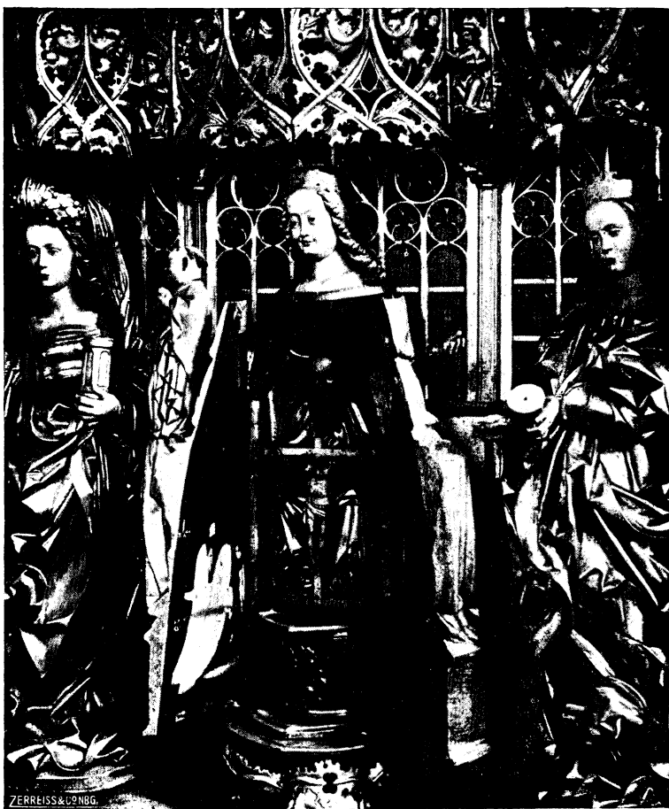
Abb. 4. Schreinmadonna im Hochaltar der Marienkirche zu Elbing. (geöffnet)

bildung 5 und 6), die neben genauer Übereinstimmung im Gegenständlichen auch alle jene Einzelzüge zeigt, welche die Madonnen von Nürnberg und Elbing verbinden (Vergoldung 27) , Organisation des Gefalts bis in Kleinigkeiten hinein, die Stellung der Füße bei Maria, beim Kinde der Faltenbausch, in dem der linke Arm ruht und das Umklammern des