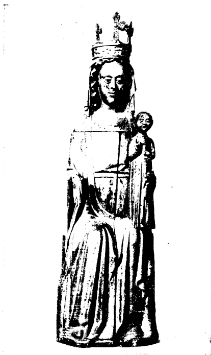
Abb. 23: geschlossener Zustand

Die nächste Weiterbildung des Dreieinigkeitsstyps über das alte Gnadenbild von Morlaix hinaus, ist in einer Schreinmadonna des Kaiser-Friedrich-Museums zu Berlin erhalten (Abb. 23 u. 24) 83 ). Bei geöffneten Flügeln erscheint unter der Brust der Maria eine hohle, vergoldete Viertelkugel, die nicht als Behälter (etwa für Reliquien) gedient hat, da sie