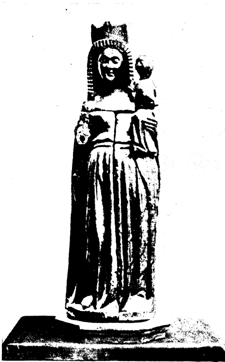
Abb. 25: geschlossener Zustand

Der späteste Abkömmling dieser Reihe ist die Madonna von Alluyes, Eur et Loir 89 ). Sie gleicht im Aufbau den eben behandelten Figuren. Auf