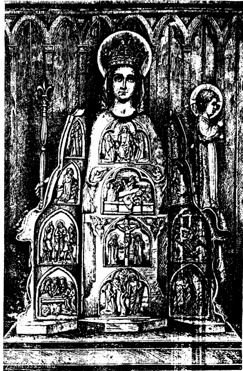
Abb. 18: geöffneter Zustand zu Quelven (Bretagne), 1320—1330.

Die Datierung stößt auf Schwierigkeiten wegen des Erhaltungszustandes. Eine Lokaltradition behauptet, die Madonna sei eine Stiftung der Gründerin des Klosters, Blanka von Kastilien (1187—1252; seit 1215 mit Ludwig VIII. von Frankreich vermählt). Guilhermy 68 ) hält sie für eine Arbeit der Mitte des 13. Jahrhunderts, während Depoin 69 ) sie wegen des satyrischen Charakters des früheren Sockels in den Anfang des 14. Jahrhunderts setzt. Vielleicht läßt sich dieser Zwiespalt dadurch klären, daß man annimmt, der Figur von Maubuisson, welche sicher noch der zweiten Hälfte des 13. Jahrhunderts angehört, liege ein um etwa