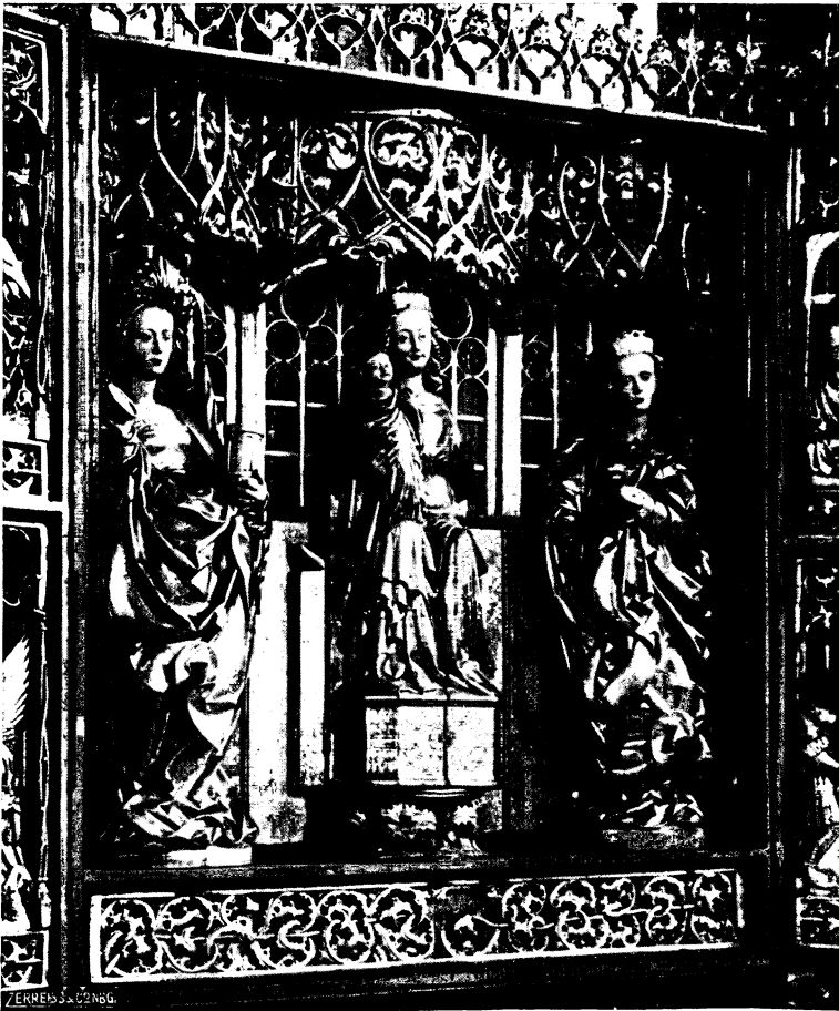
Abb. 3. Schreinmadonna im Hochaltar der Marienkirche zu Elbing. (geschlossen)

Merkwürdigerweise ist innerhalb der ganzen Überlieferung des Elbinger Dominikanerklosters, zu dem die Marienkirche gehörte, niemals von der Schreinmadonna die Rede. Da die Kirche 1504 „bis in den Grund“ abbrannte, ist es nicht einmal sicher, daß die Madonna ehemals in dieser Kirche stand 25 ). 1454 fielen Kloster und Stadt Elbing vom Deut-