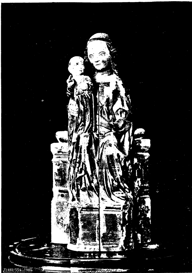
Abb. 7. Schreinmadonna in der Kirche von Klonowken, um 1400 (geschlossen)

Nur in ihren geringen Ausmaßen (Höhe 45 cm) unterscheidet sich diese Madonna von den Exemplaren in Nürnberg und Elbing. Sie kann also kein Andachtsbild einer Kirche gewesen sein, sondern höchstens ein