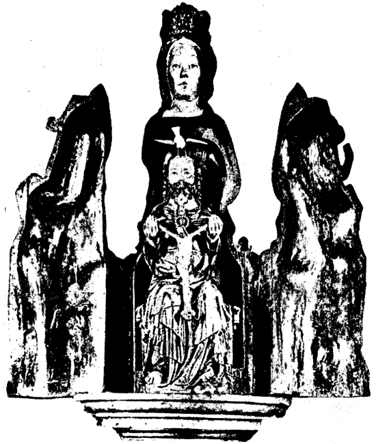
Abb. 21: geschlossener Zustand der Schreinmadonna zu Morlaix (Bretagne), Ende des 14. Jahrhunderts.