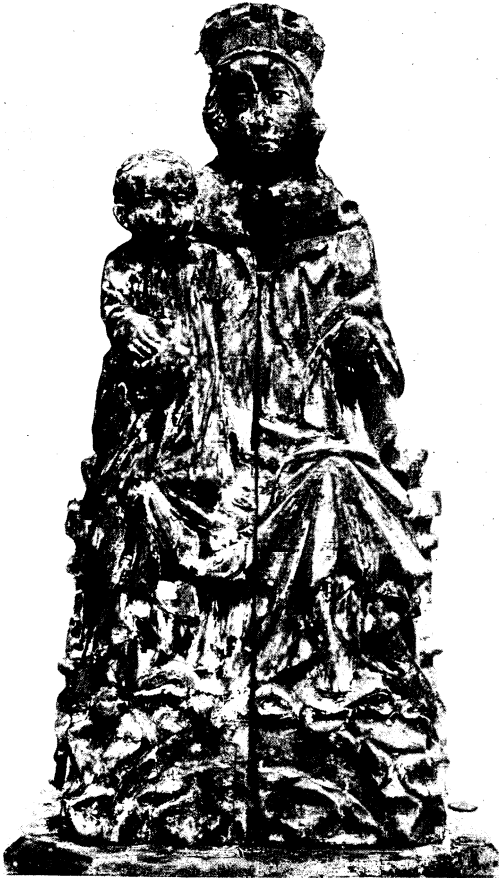
Abb. 13. Schreinmadonna zu Öfver-Torneå, Schweden (geschlossen)

Sämtliche Werke stimmen in den wichtigsten Kennzeichen überein und zwar haben wir ohne Ausnahme sitzende Marienfiguren auf bankartigem, kissenbelegtem Thron vor uns. Jedesmal steht das Kind auf dem