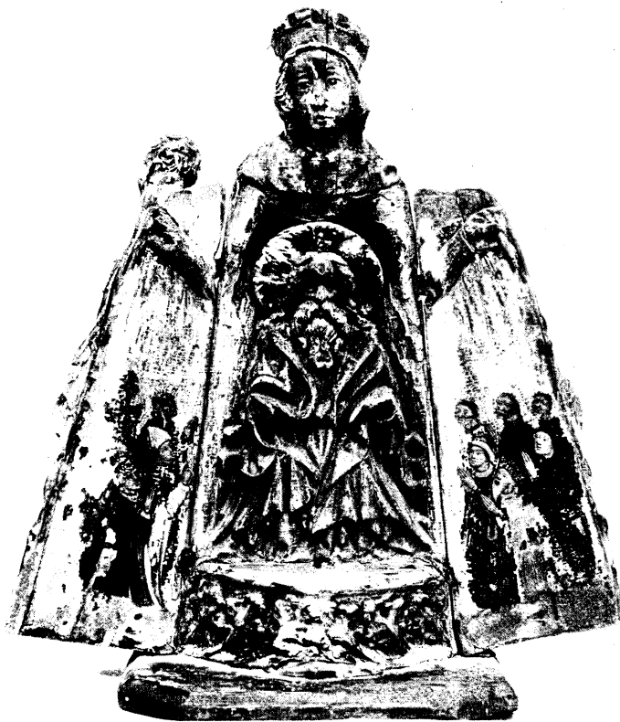
Abb. 14. Schreinemadonna zu Öfver-Torneå, Schweden (geöffnet)

Gruppe (Nürnberg, Paris, Elbing, Klonowken, Liebschau und Sejny), die sogar in der Faltenorganisation übereinstimmen und demnach als mehr oder weniger unmittelbare Repliken eines Urbildes, vielleicht eines Gnadenbildes anzusehen sind. Die beiden schwedischen Werke sind als Ableitungen zweiten Grades zu betrachten.