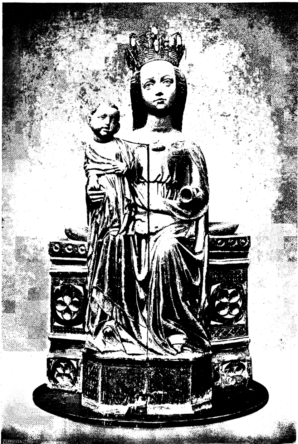
Abb. 1. Schreinmadonna, Westpreußen, um 1390. Nürnberg, Germanisches Museum. Geschlossener Zustand. (Krone nicht zugehörig)