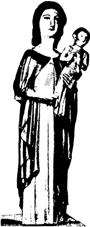
Abb. 19: geschlossener Zustand der Schreinmadonna

Eine Weiterleitung dieses westschweizerischen Madonnentyps des späten 14. Jahrhunderts stellt das Bruchstück einer Schreinmadonna im Schweizer Landesmuseum in Zürich dar. Sie stammt aus der St. Joderkapelle im Obergrund von Luzern und gehört, nach den Malereien der Flügel zu schließen der ersten Hälfte des 15. Jahrhunderts an 76 ). Im geschlossenen Zustand ergeben sich in der Art des Stehens der Madonna