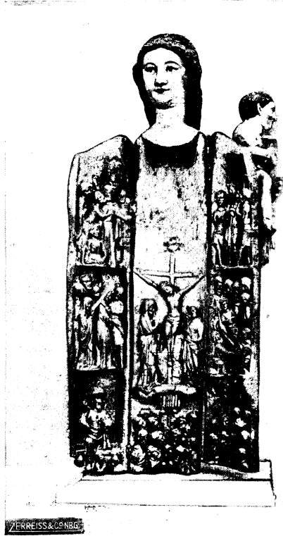
Abb. 20: geöffneter Zustand zu Cheyres (Westschweiz), um 1380.

und im Sitzmotiv des Kindes offenbare Beziehungen zu den Figuren in Cheyres und Marly. Die Flügel tragen Malereien: je ein nach innen gewendeter aufwärtsblickender Engel.