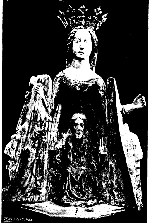
Abb. 11: geschlossener Zustand