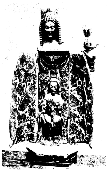
Abb. 26: geöffneter Zustand

der Schreinmadonna in Palau-del-Vidre (Pyrenäen).