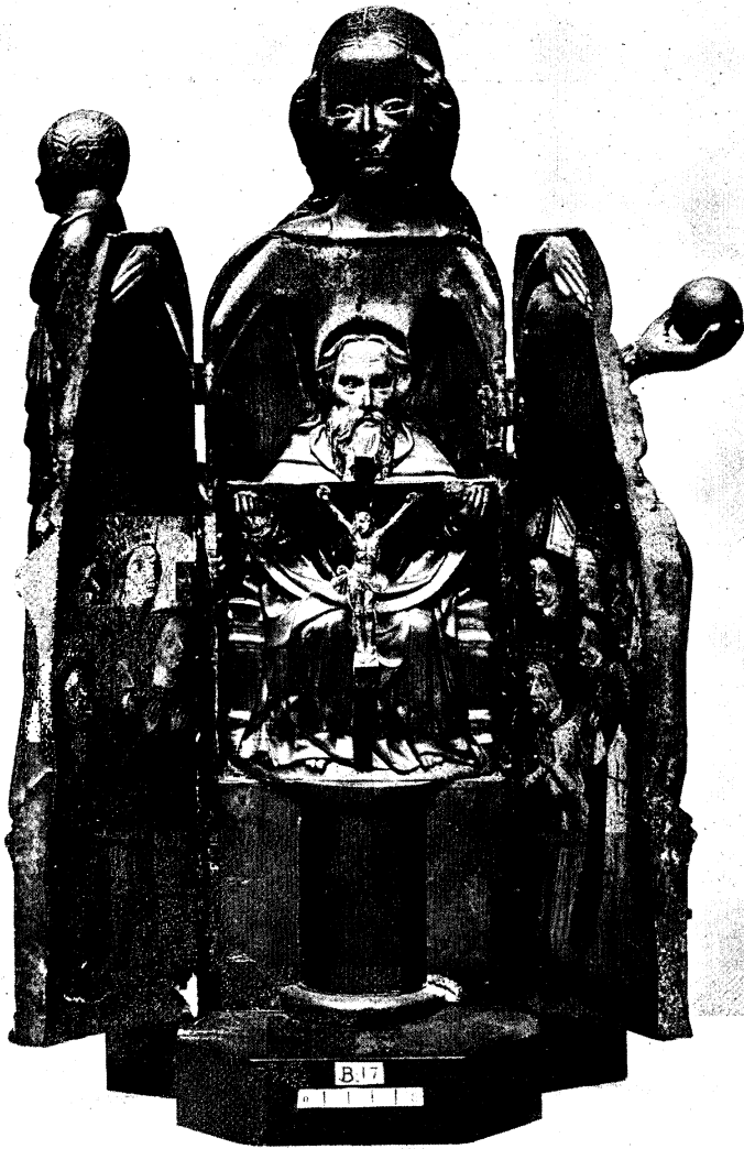
Abb. 6. Schreinmadonna, Westpreußen, gegen 1400. Paris, Cluny-Museum (geöffnet)