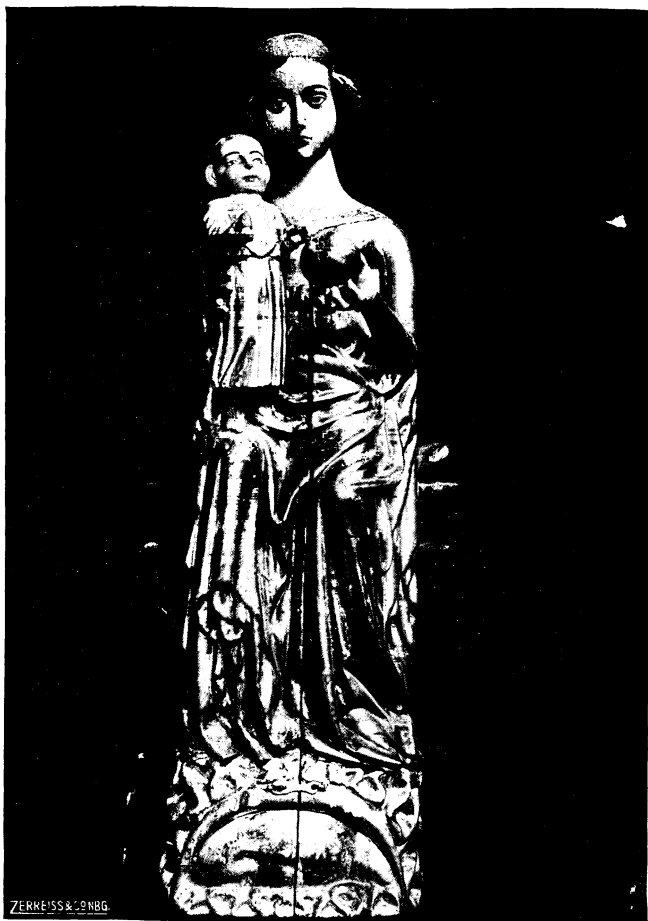
Abb. 9. Schreinmadonna - in der Kirche zu Liebschau, Anf. d. 15. Jhrh. (geschlossen)

Das dritte in Westpreußen verbliebene Werk unserer Gruppe steht in Liebschau (Lübschau) in Polen, ehemals Westpreußen, Kreis Dir-