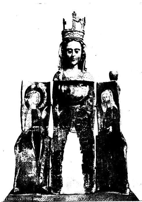
Abb. 24: geöffneter Zustand