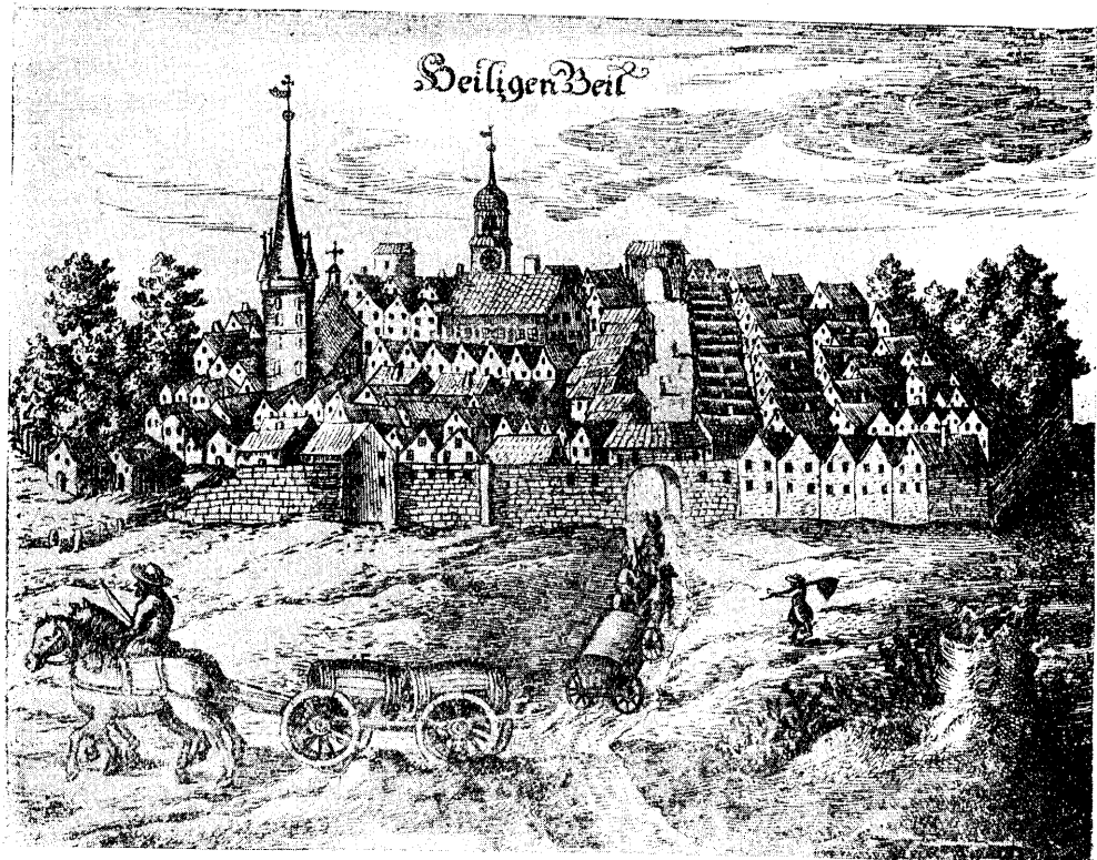
Eine Ansicht der Stadt Heiligenbeil um das Jahr 1675.