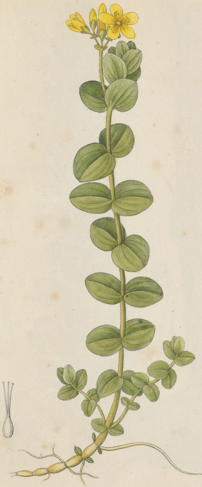
Hypericum elodes Linne.