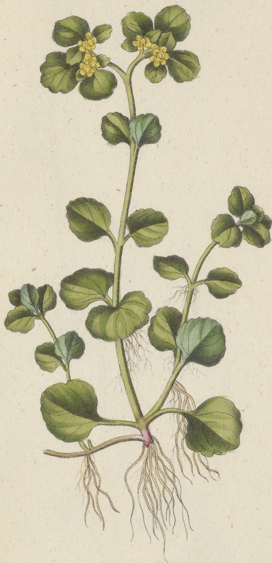
Chrysosplenium oppositifolium Linné.