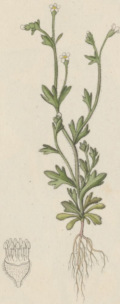
Saxifraga tridactylites Linne'.