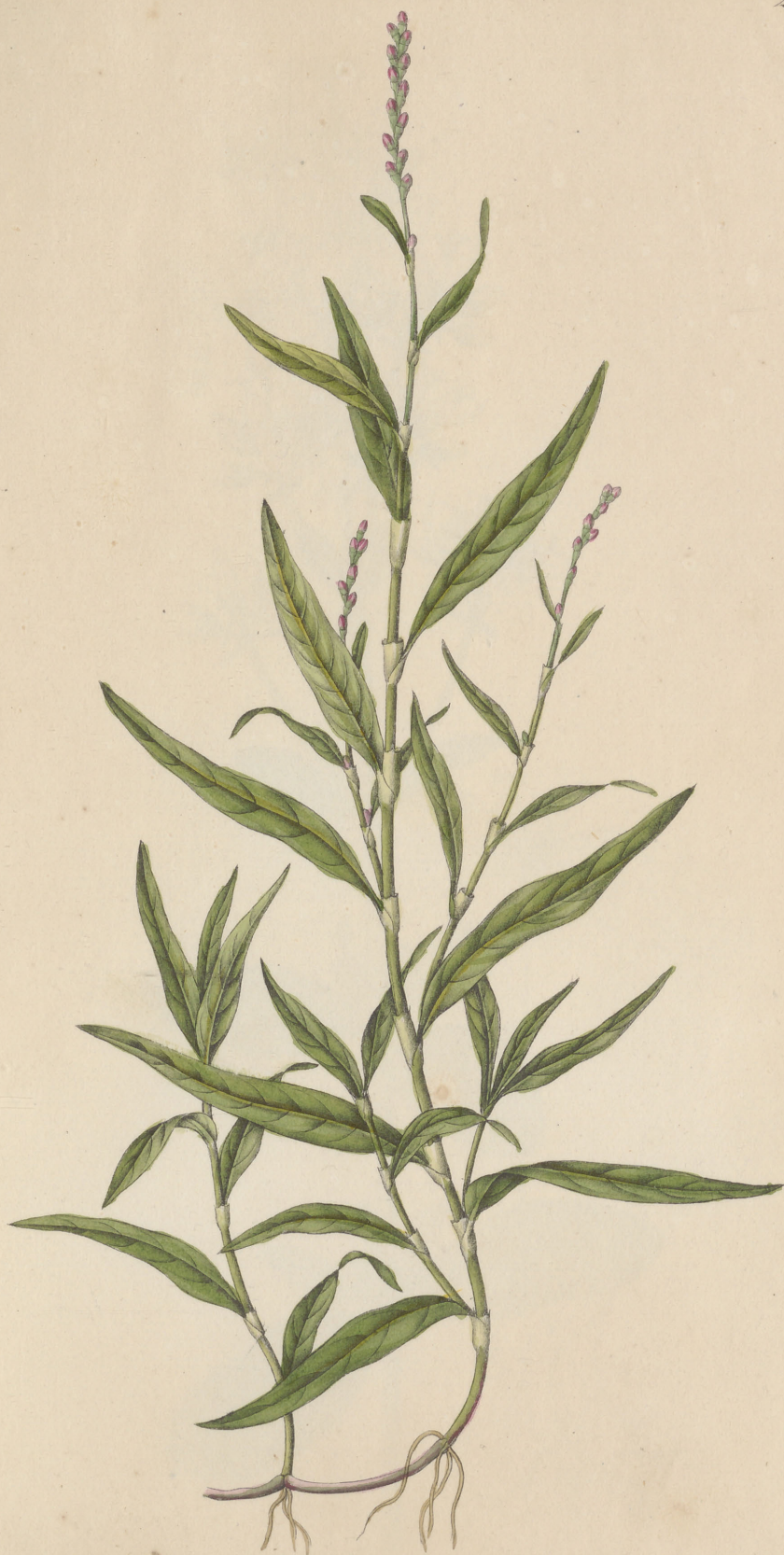
Polygonum minus Hudson.