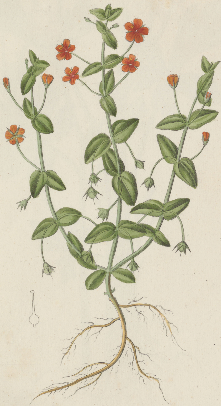
Anagallis phoenicea Lamark.