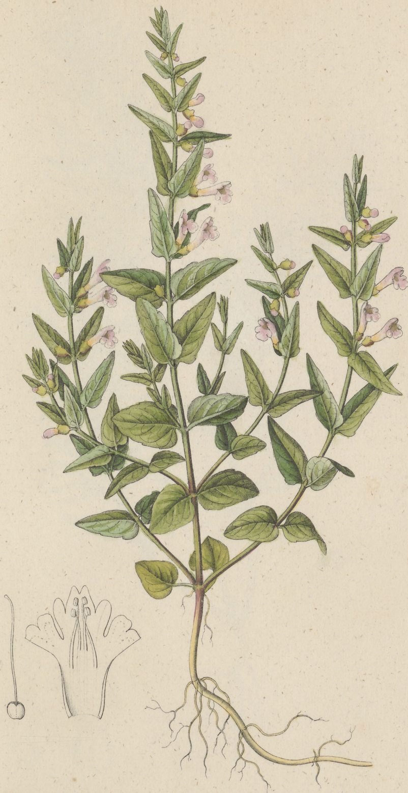
Scutellaria minor Linne.