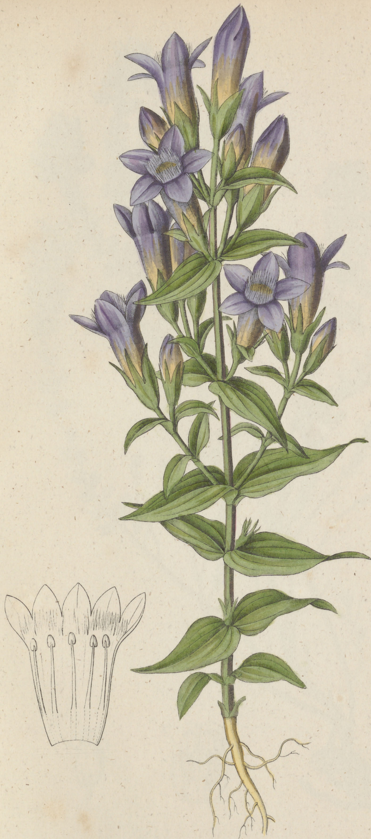
Gentiana germanica Willdenow.