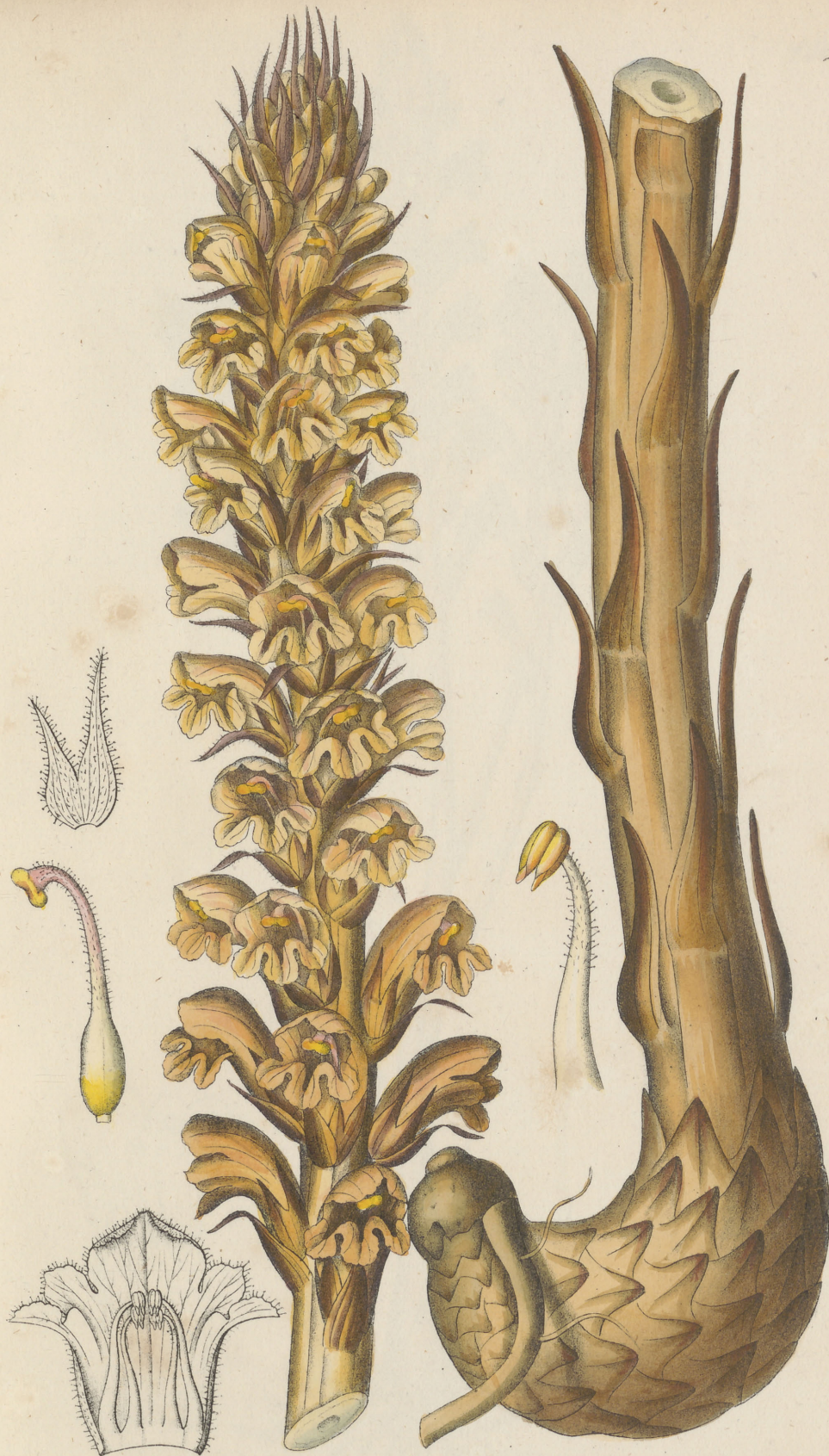
Crobanche Rapum Thuillier.