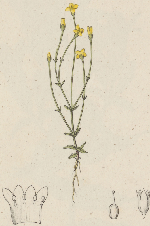
Exacum filiforme Willdenow.