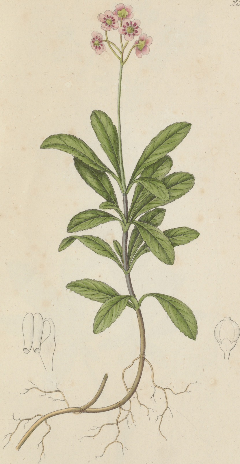
Chimaphila umbellata Nuttall.