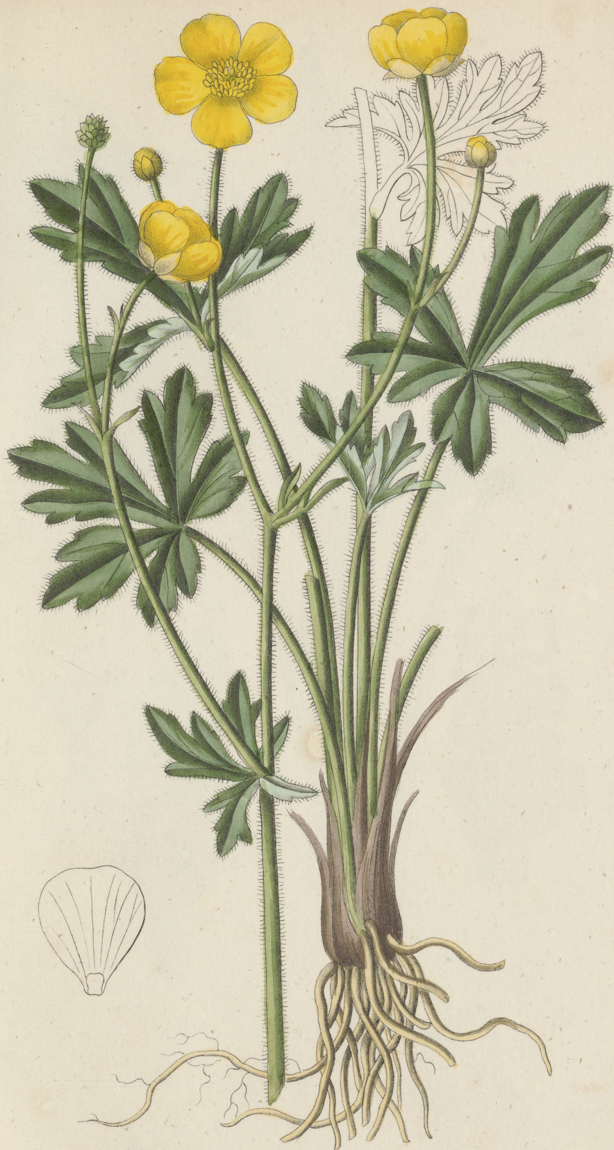
Ranunculus polyanthemos Linne.