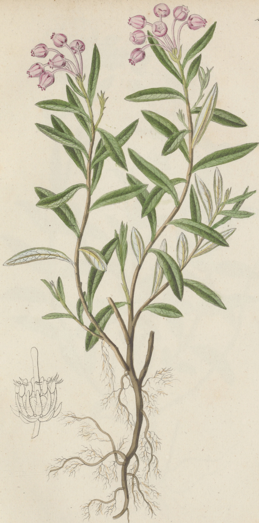
Andromeda polifolia Linne.