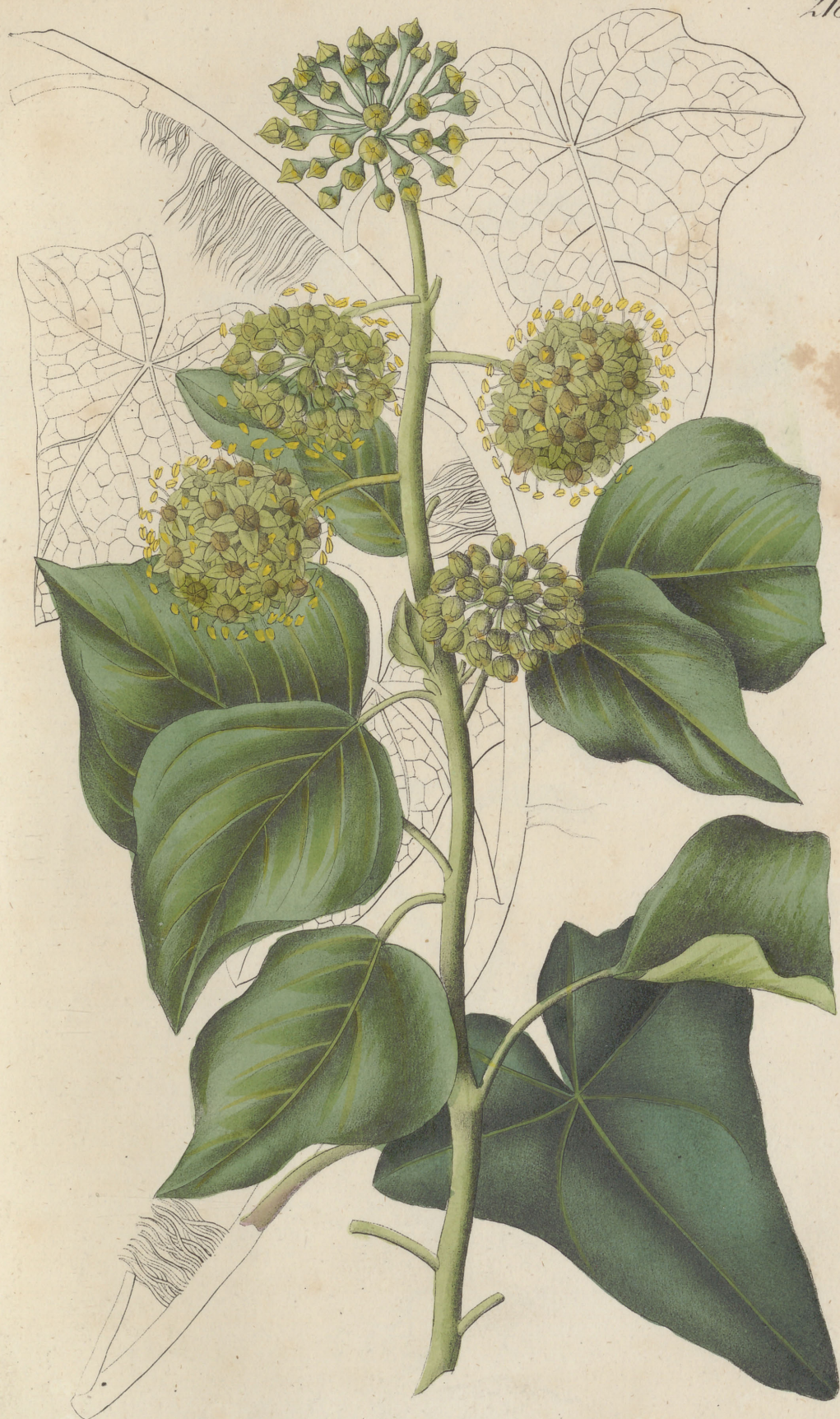
Hedera Helix Linné