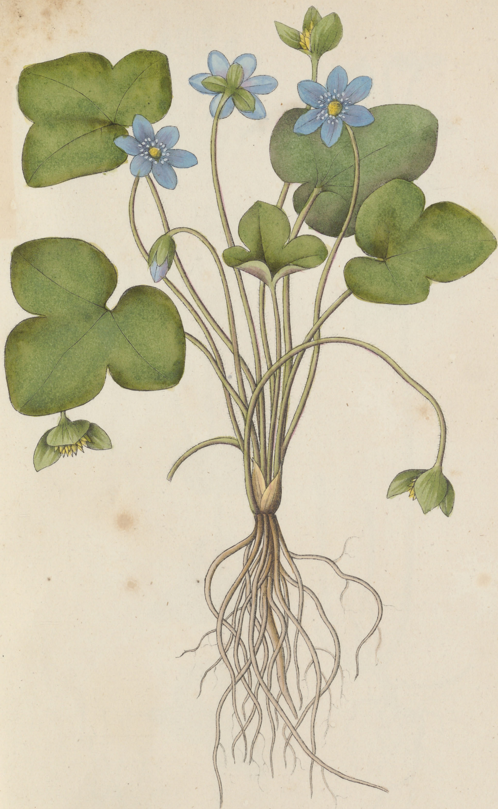
Hepatica triloba Chaix.