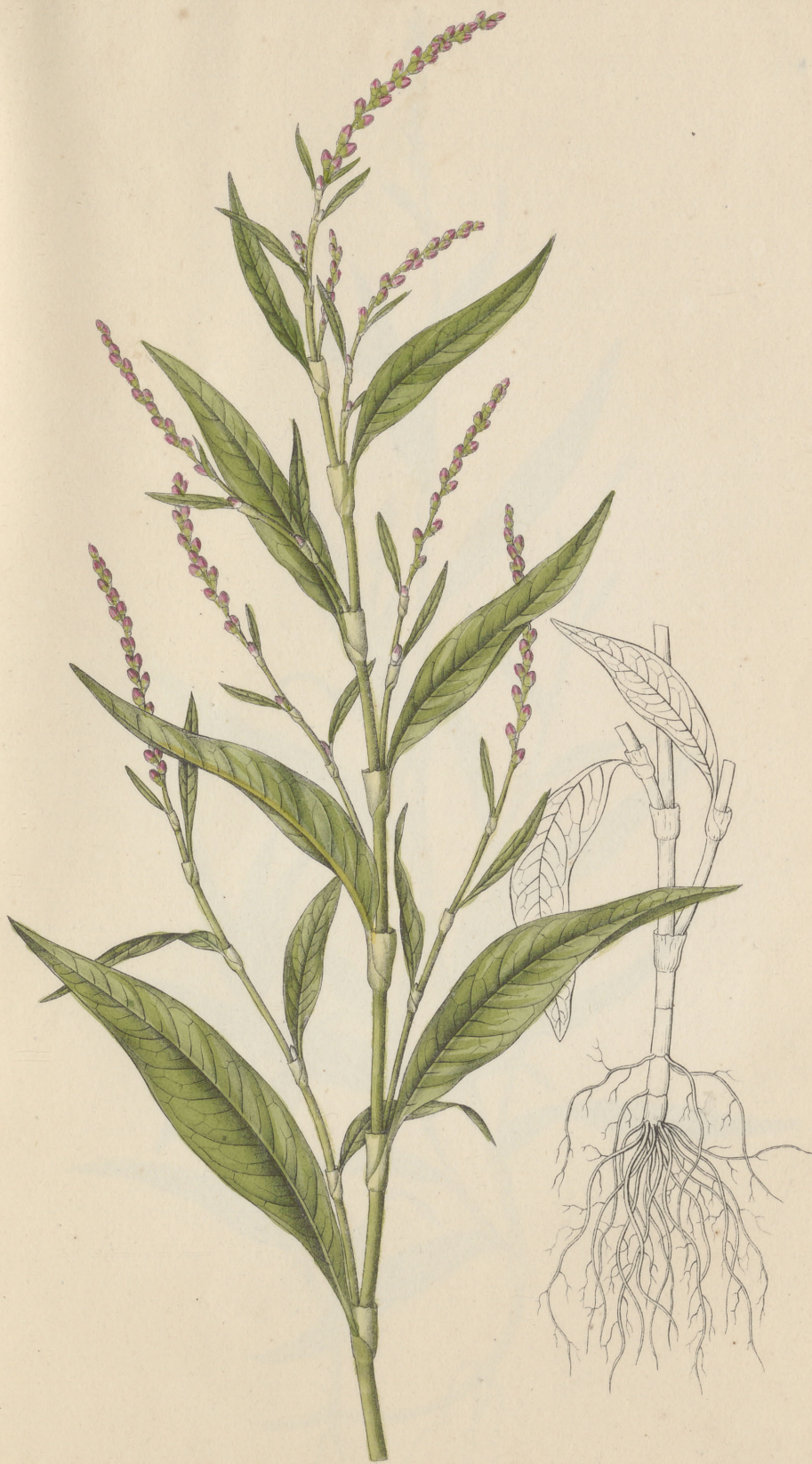
Polygonum Hydropiper Linne.