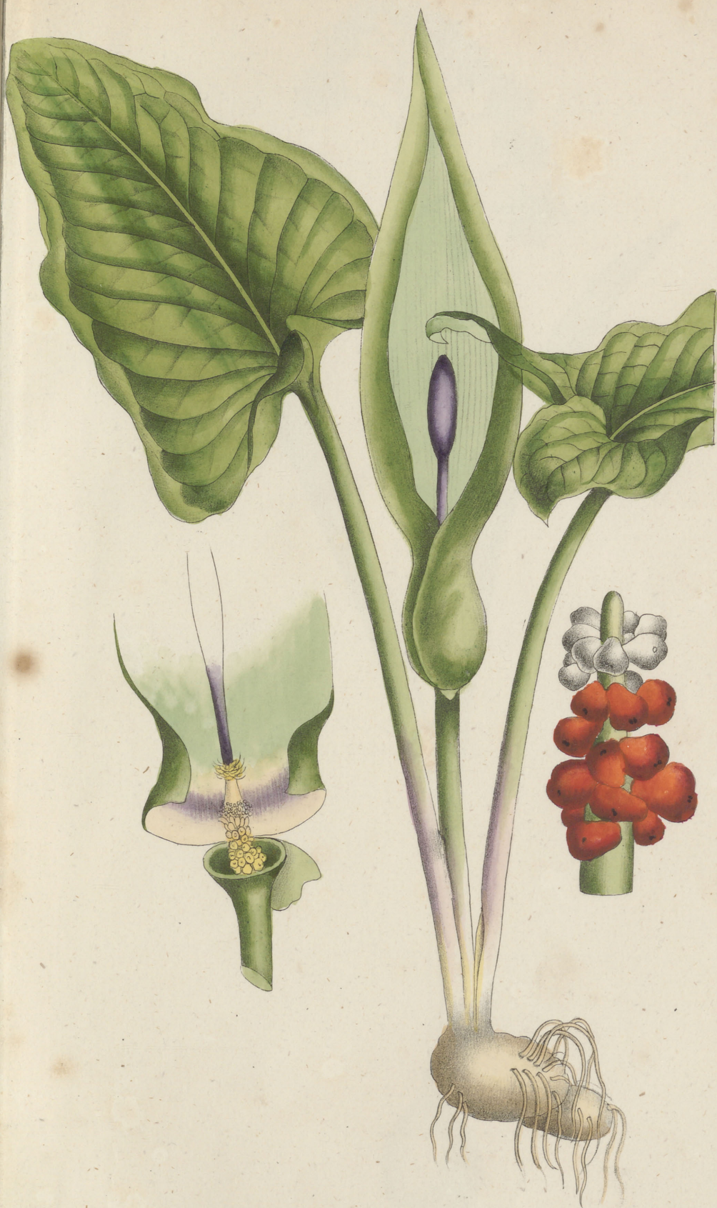
Arum maculatum Linne.