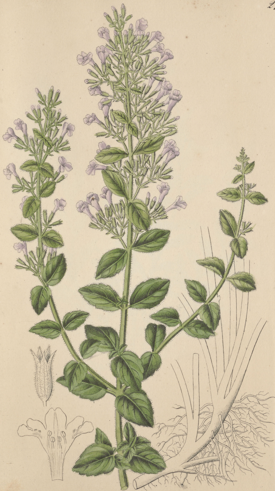
Calamintha officinalis. Moench.