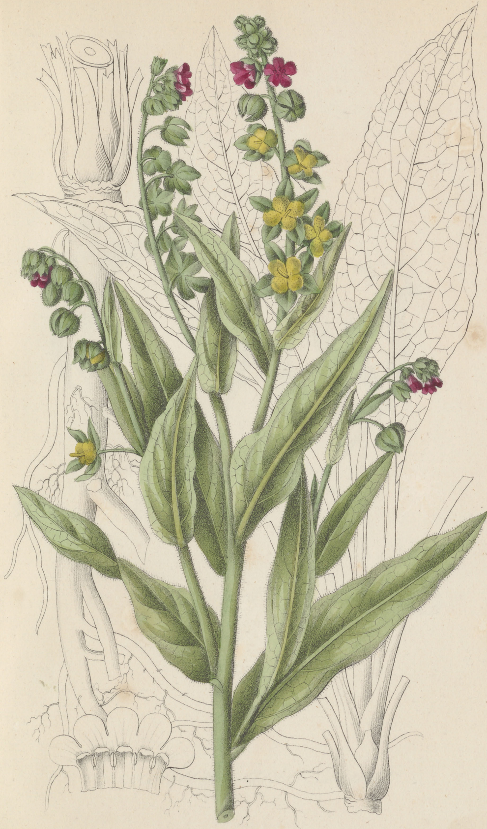
Cynoglossum officinale Linné. Gmelin & Zinniger F. L.