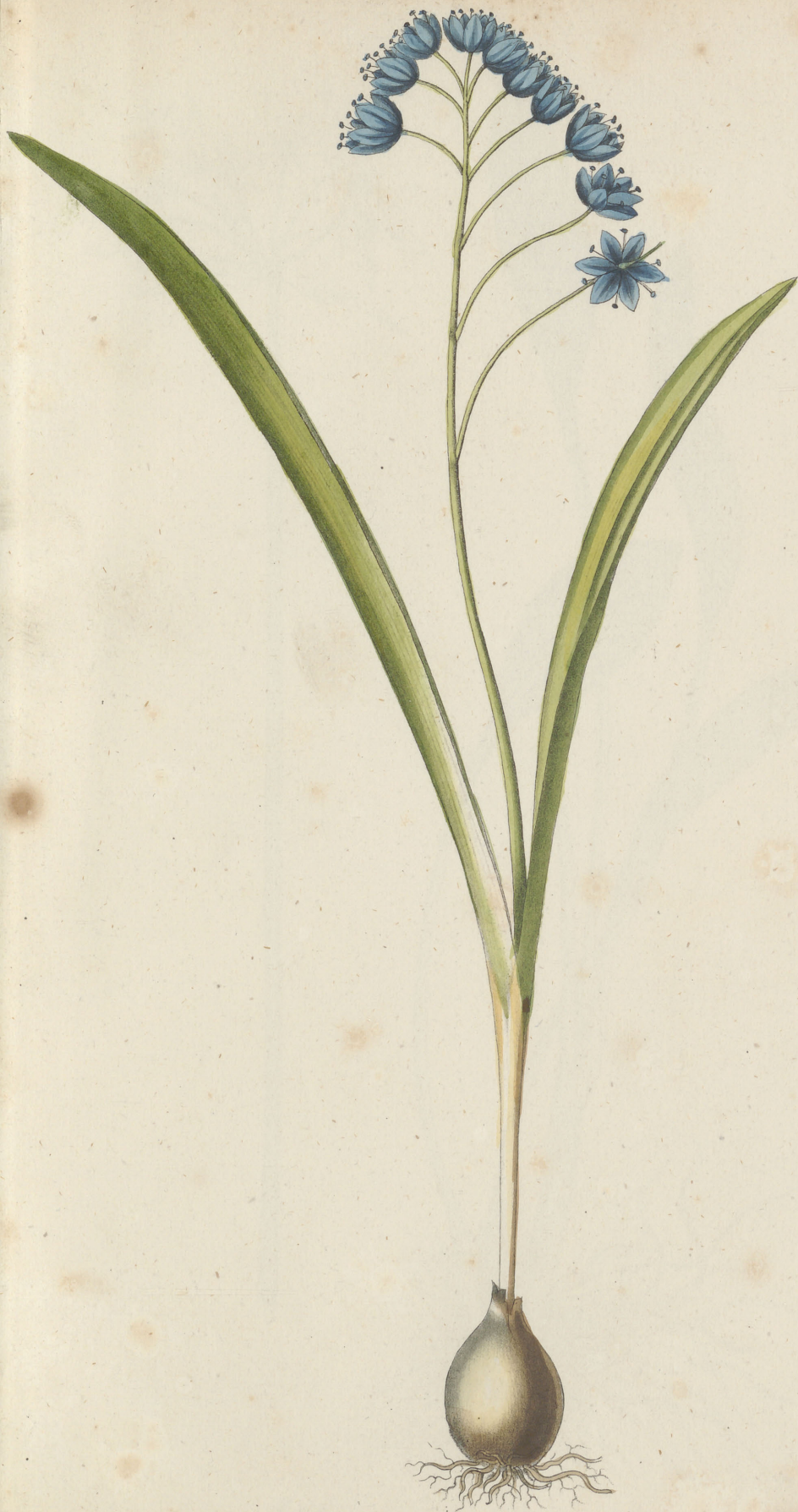
Scilla bifolia Aiton.