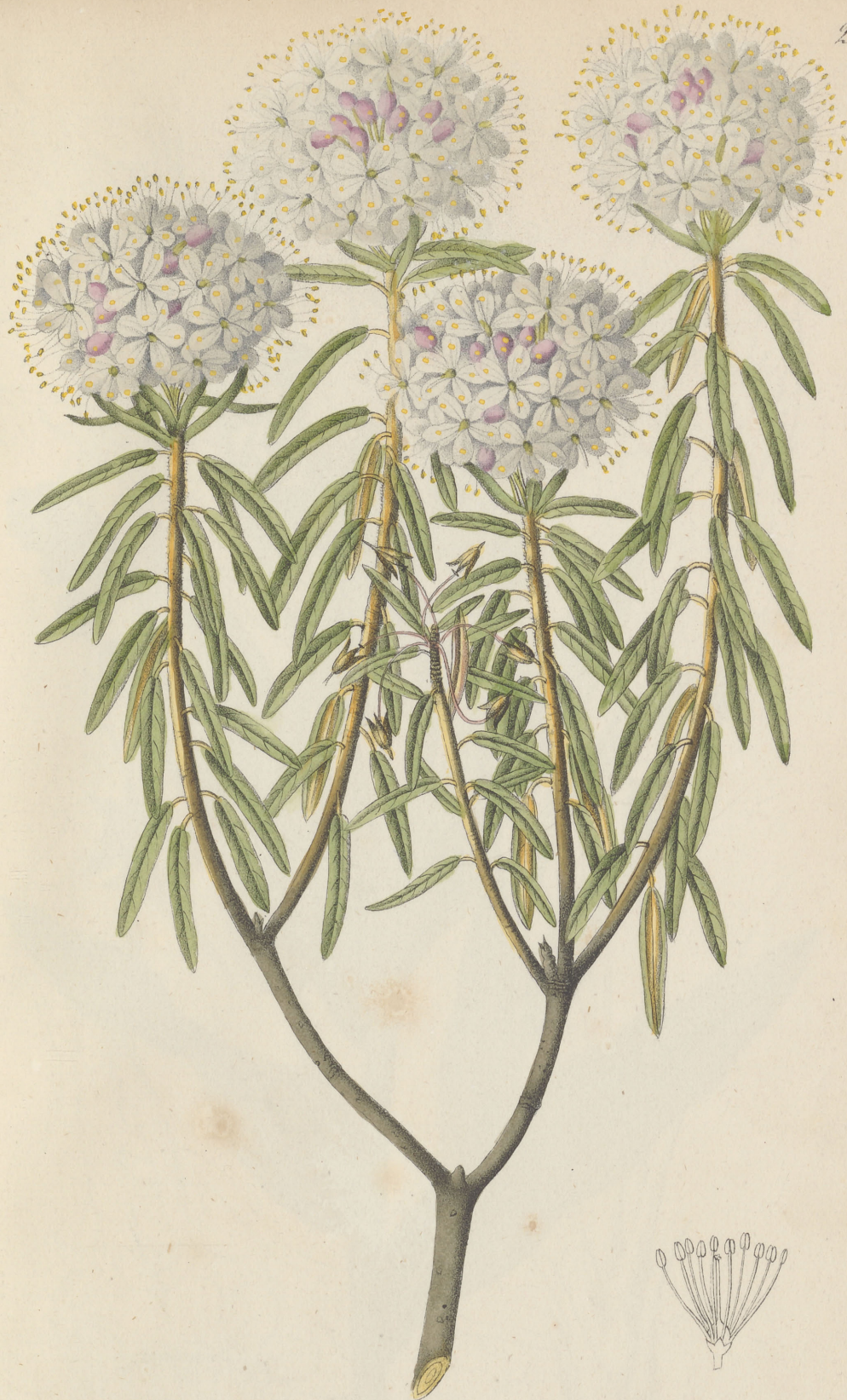
Ledum palustre Linné. Pinney. Flor. II L.