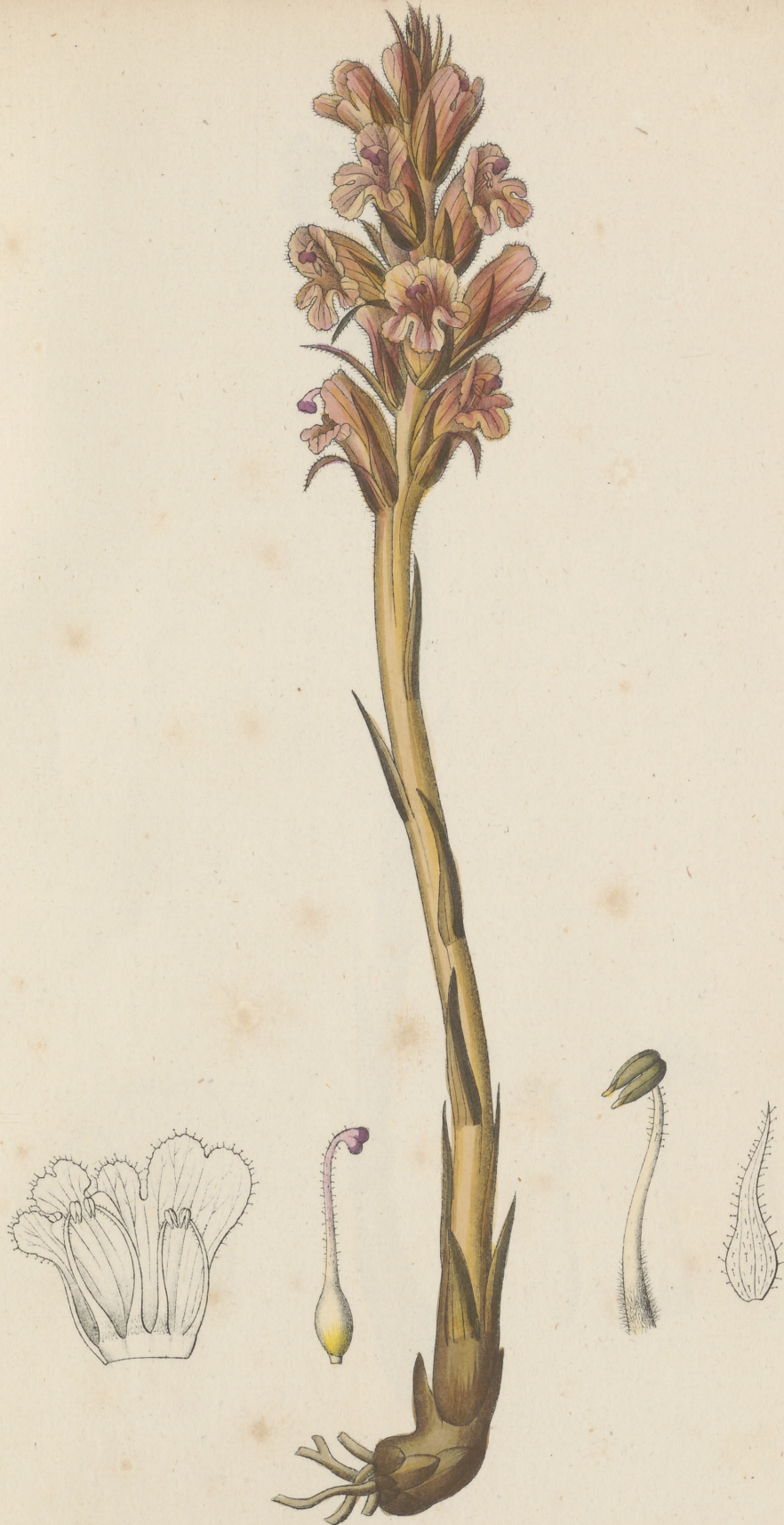
Crobanche Epithymum De Candolle.