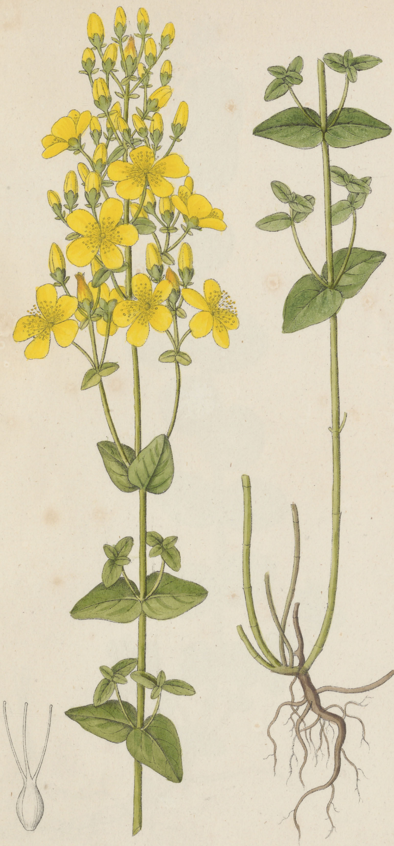
Hypericum pulchrum Linne.