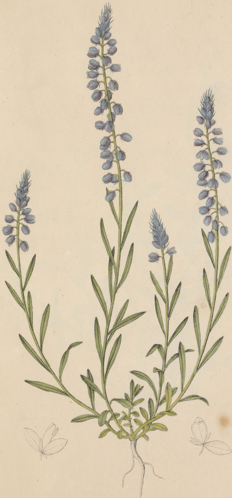
Polygala comosa Schkuhr.