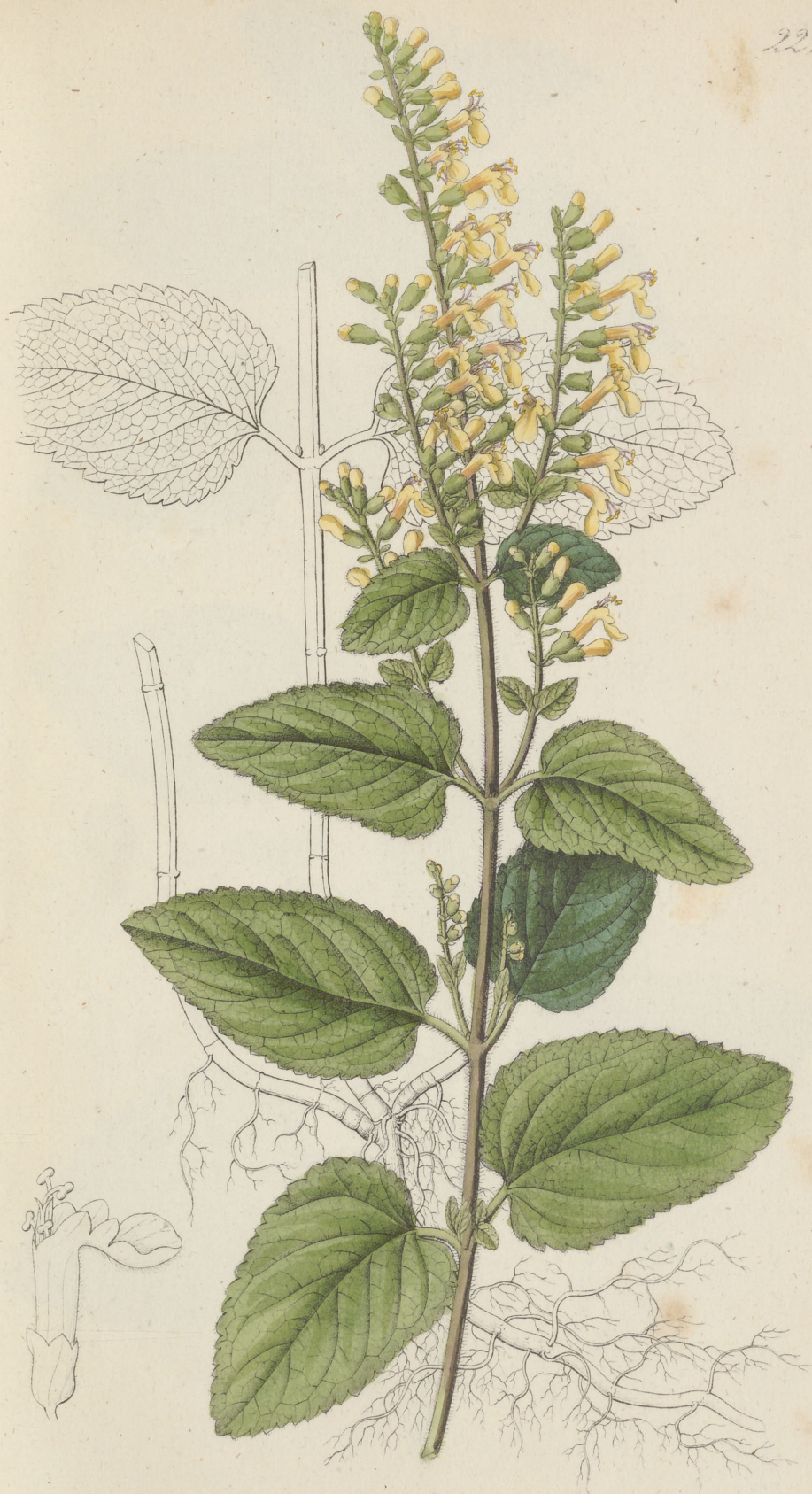
Teucrium Scorodonia Senné.