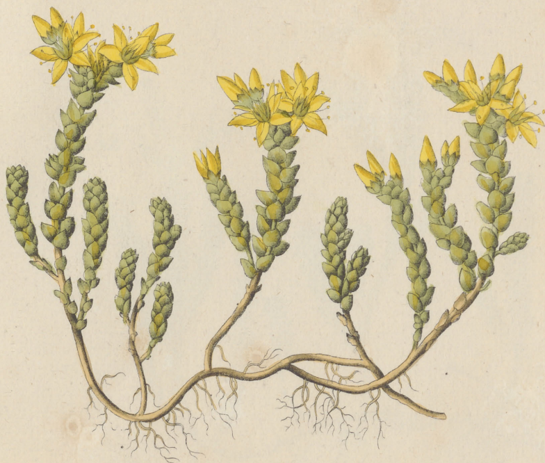
Sedum acre Linné.