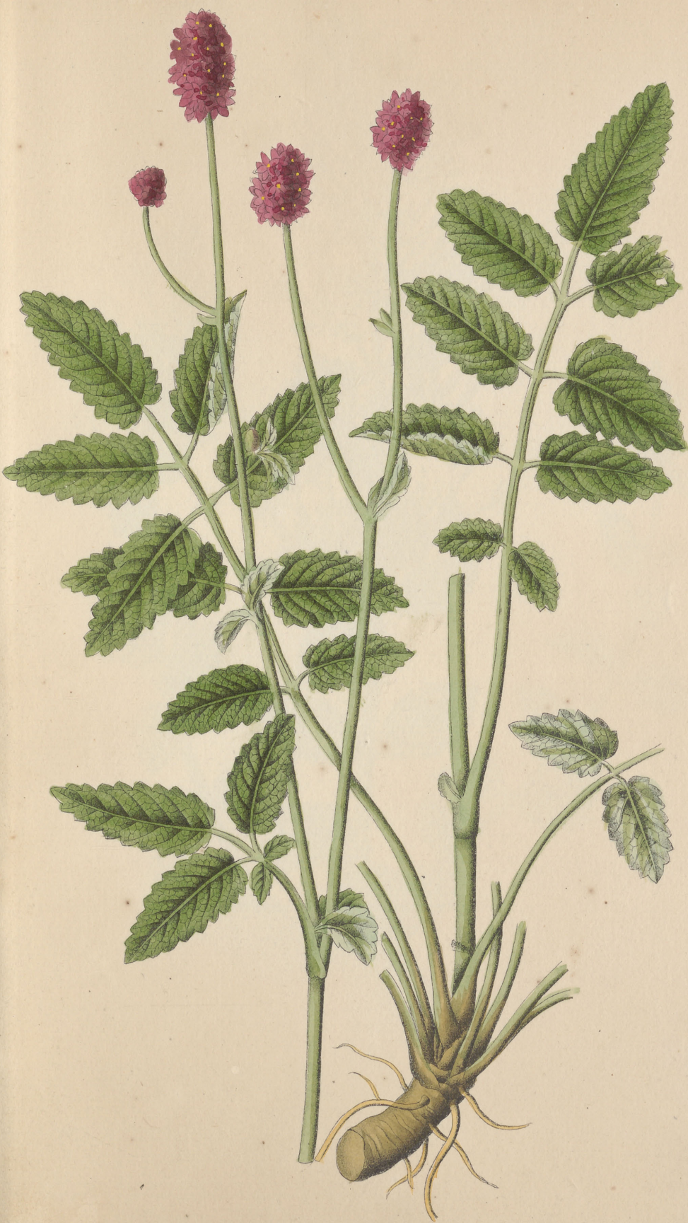
Sanquisorba officinalis Linne.