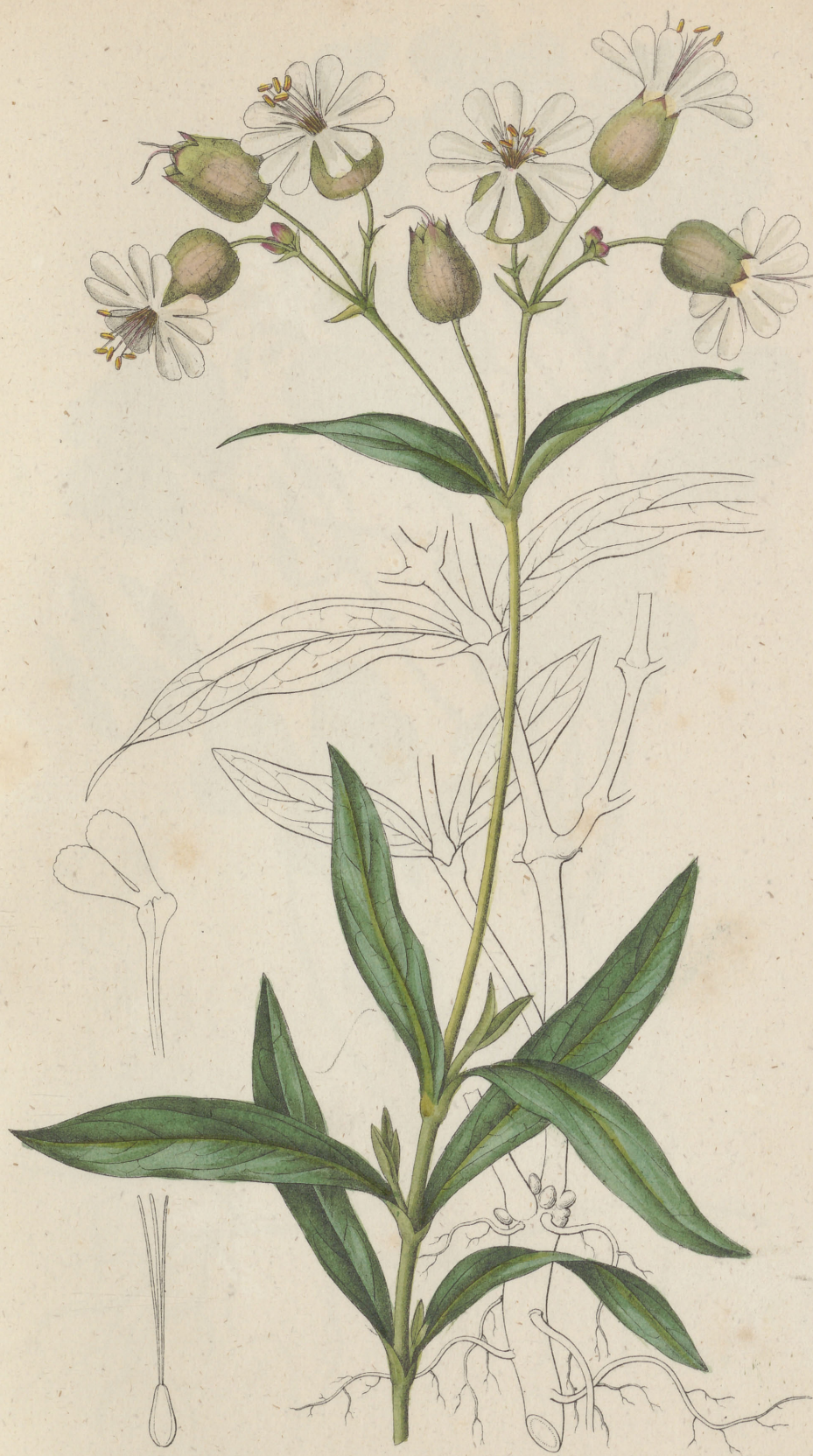
Silene inflata Smith.