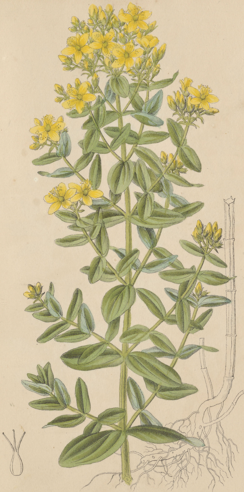
Hypericum tetrapterum Fries.