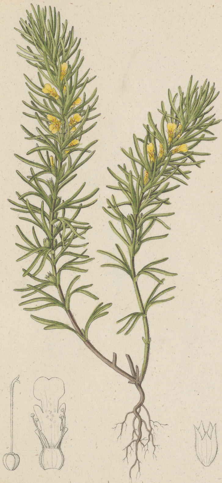
Ajuga Chamaepitys Linné.