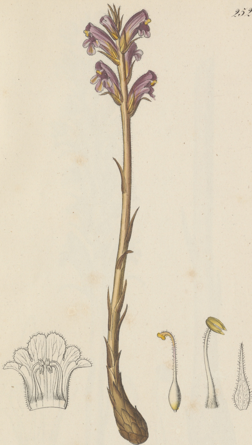
Orobanche rubiginosa Dietrich.