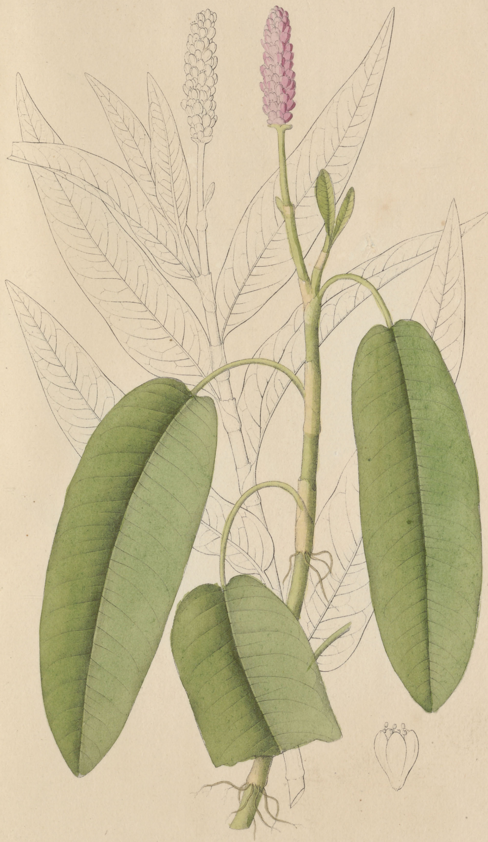
Polygenum amphibium Linne.