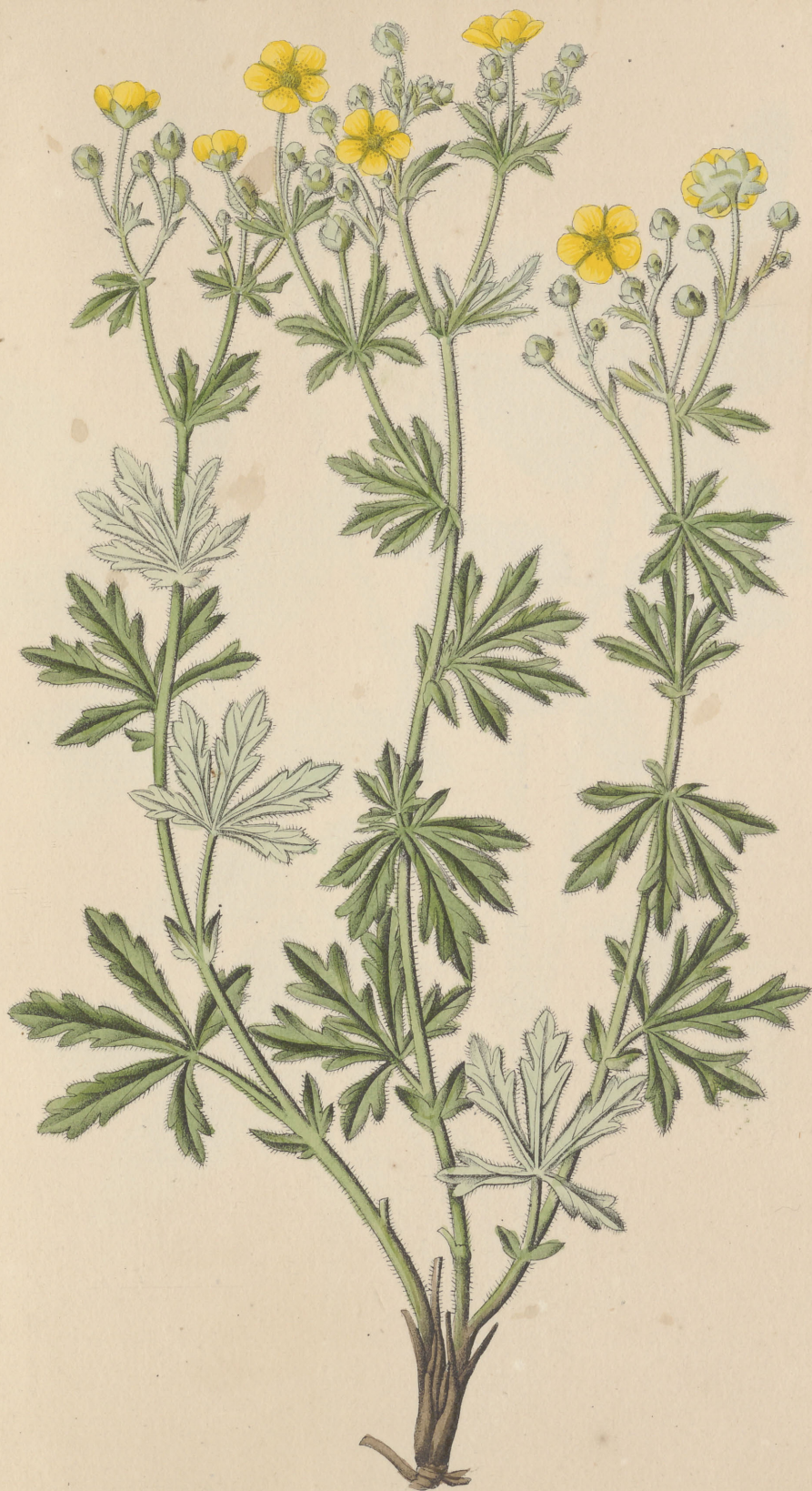
Potentilla argentea Linné.