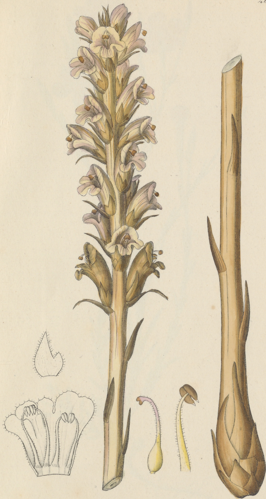
Orobanche laxiflora Reichenbach.