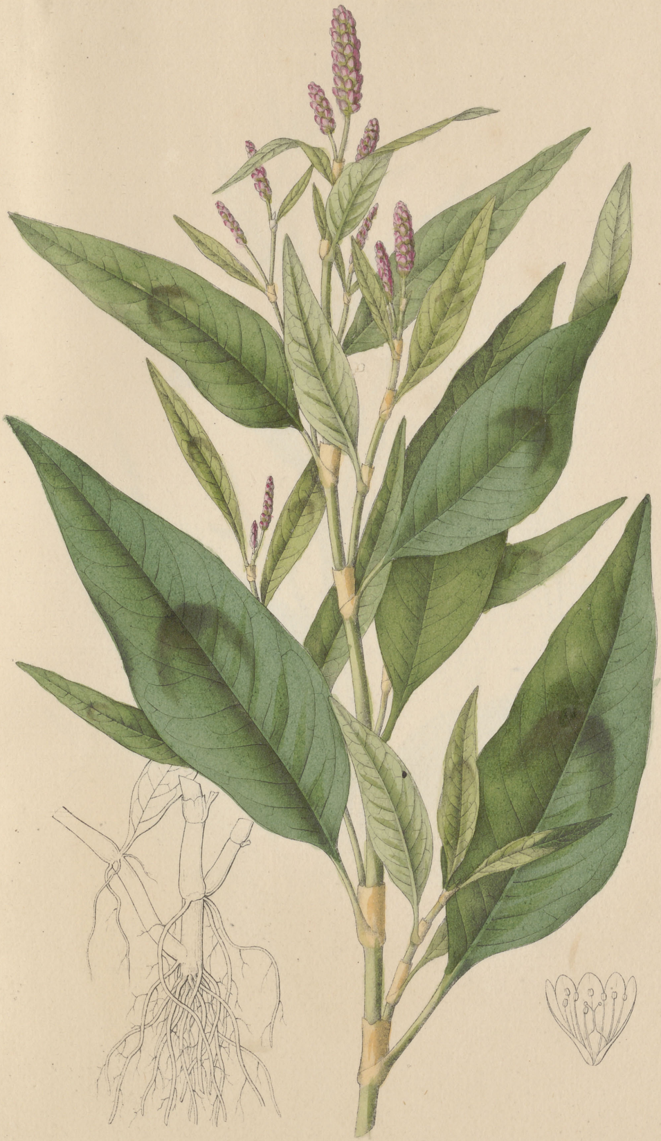
Polygonum Persicaria Linné.