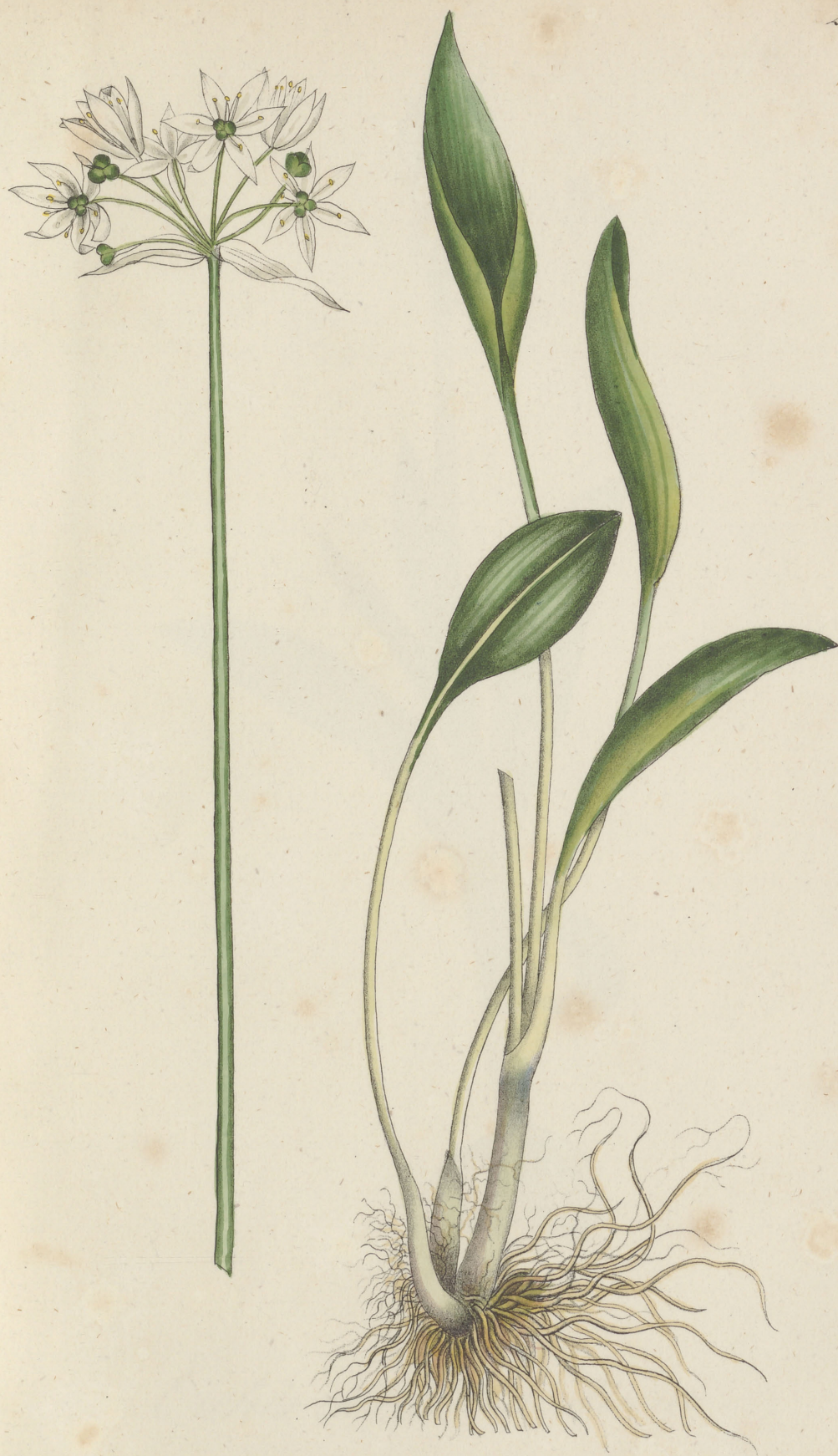
Allium ursinum Linné.