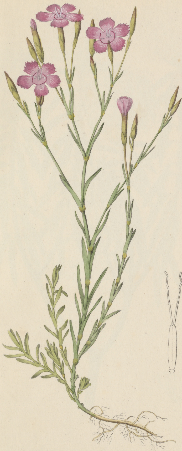
Dianthus deltoides Linné.