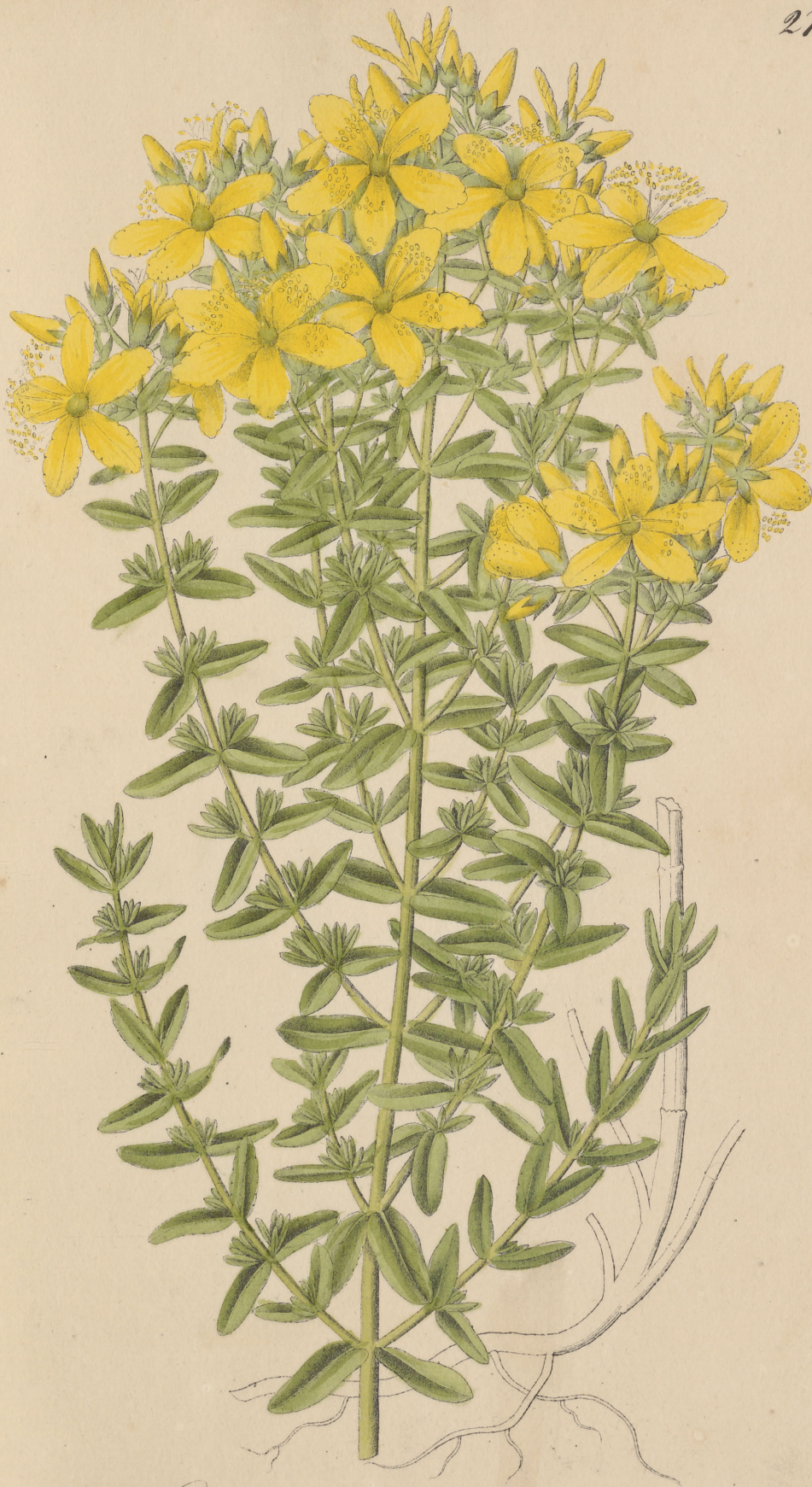
Hypericum perforatum Linné.