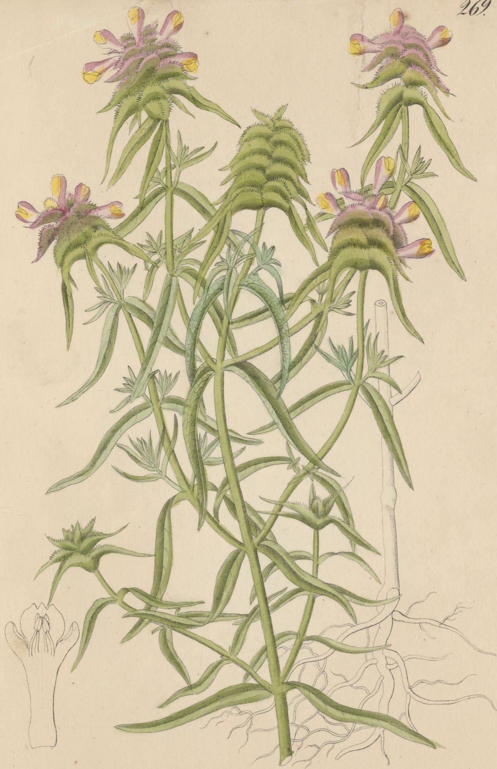
Melampyrum cristatum Linne.