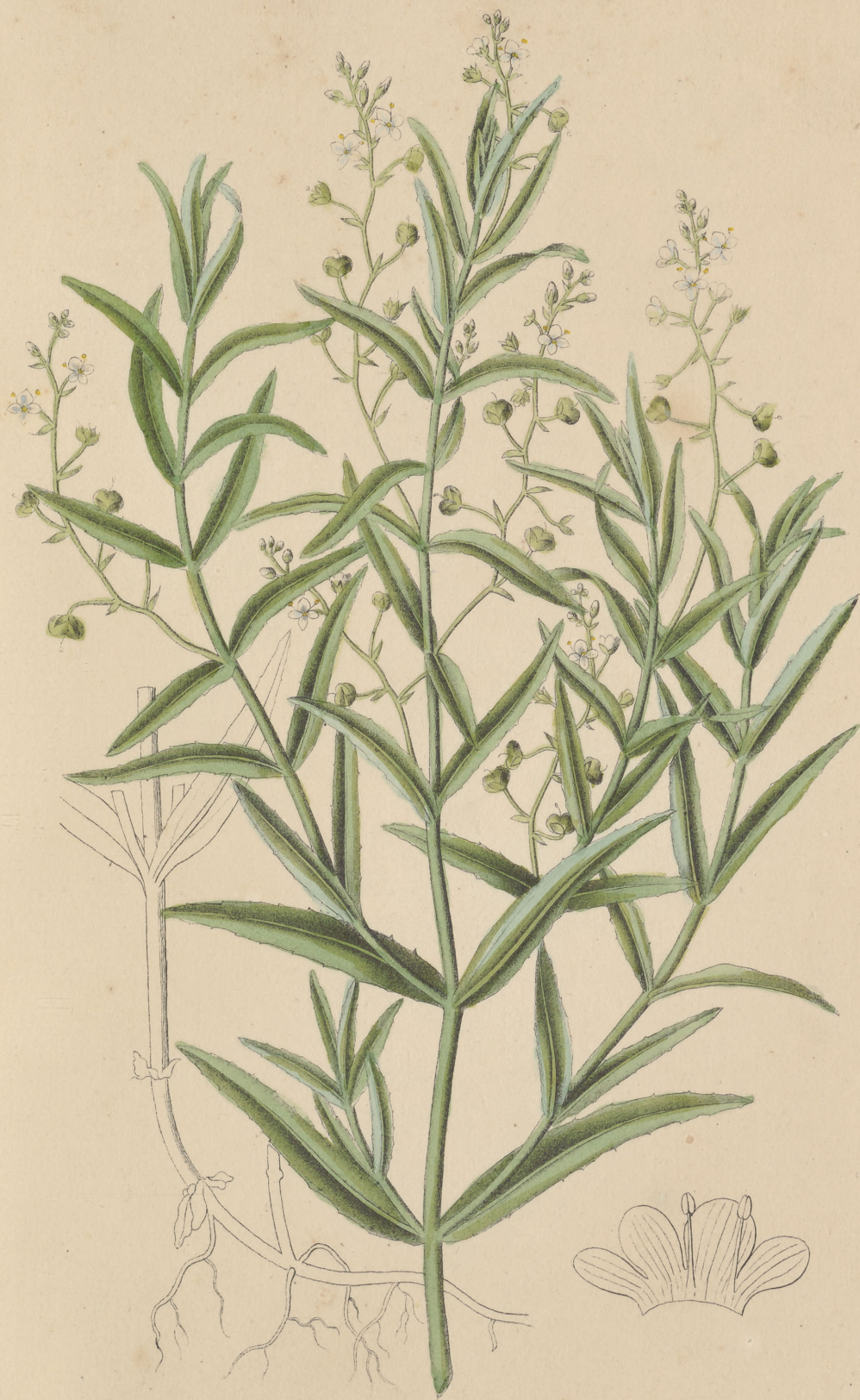
Veronica scutellata Linné.