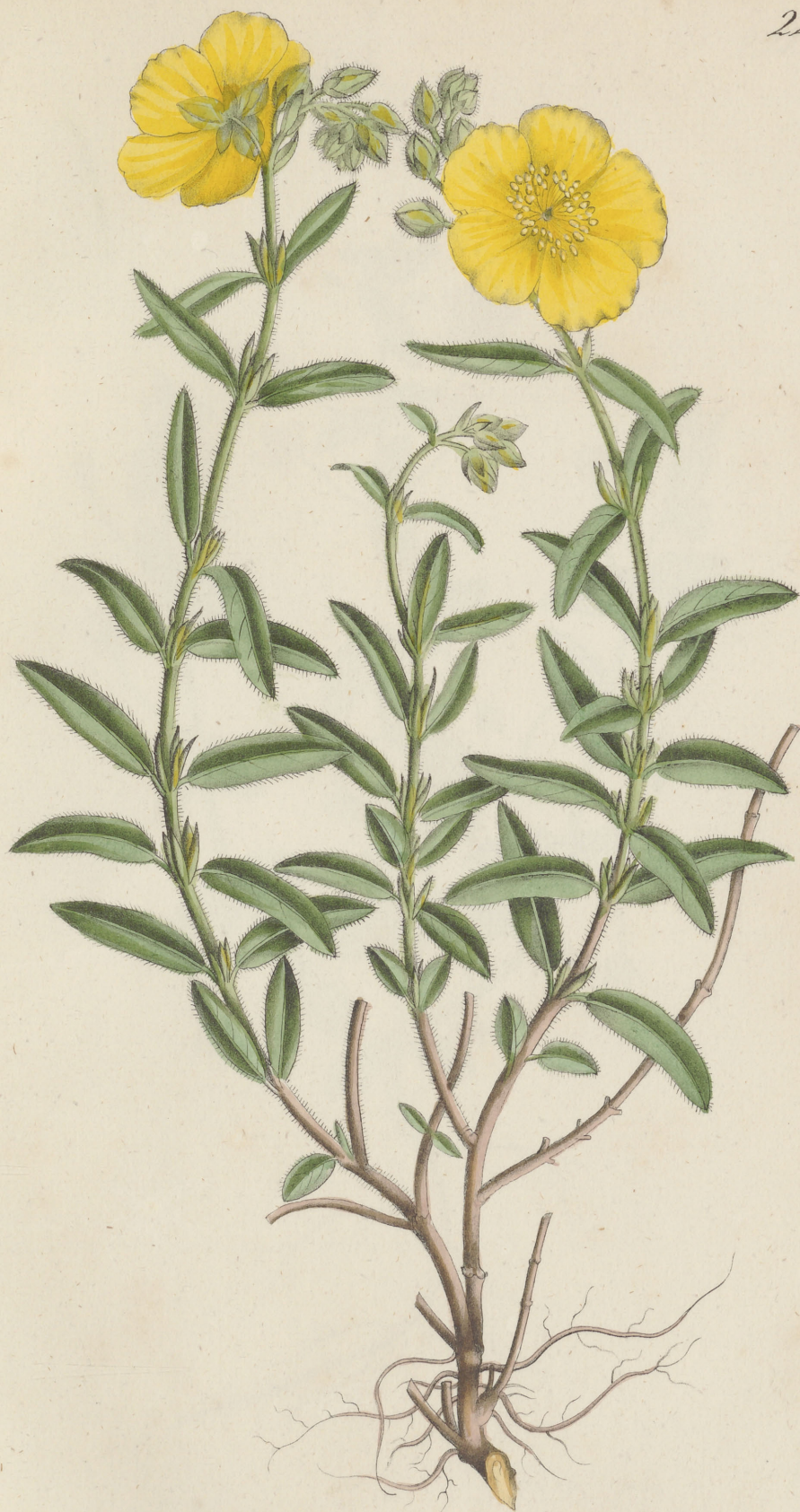
Helianthemum vulgare Gärtner.