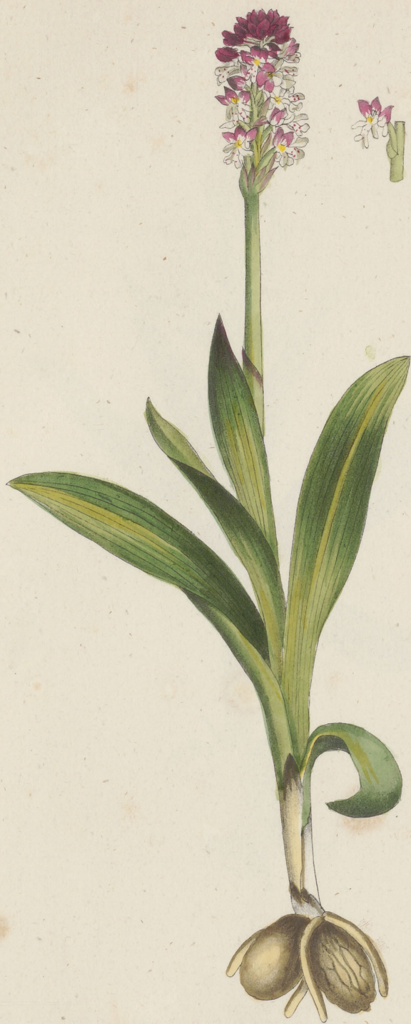
Orchis ustulata Linné.