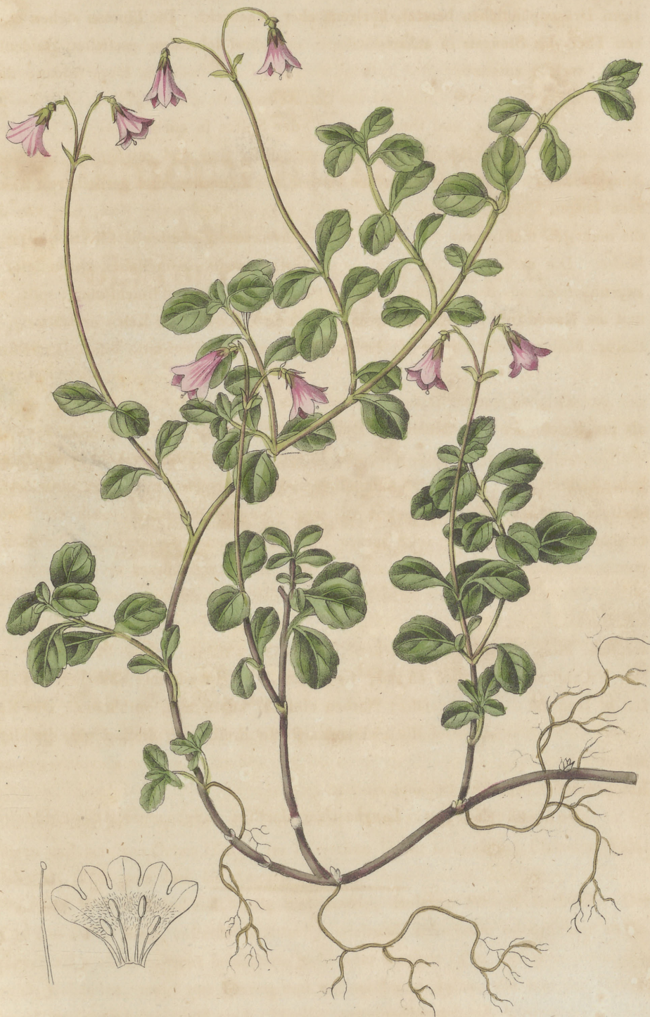
Linnaea borealis Gronovius. modiffo Linnæa III. L.