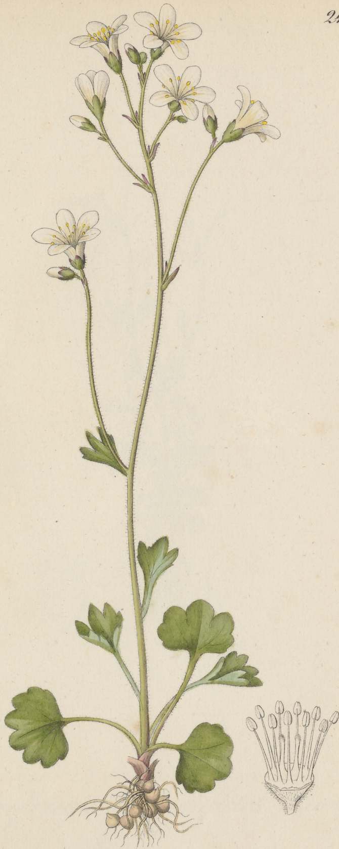
Saxifraga granulata Linné. Saxifraga granulata Linné.