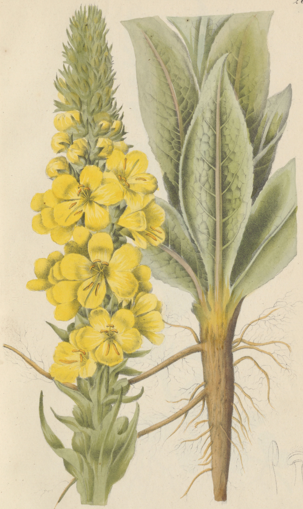
Verbascum thapsiforme Schrader.