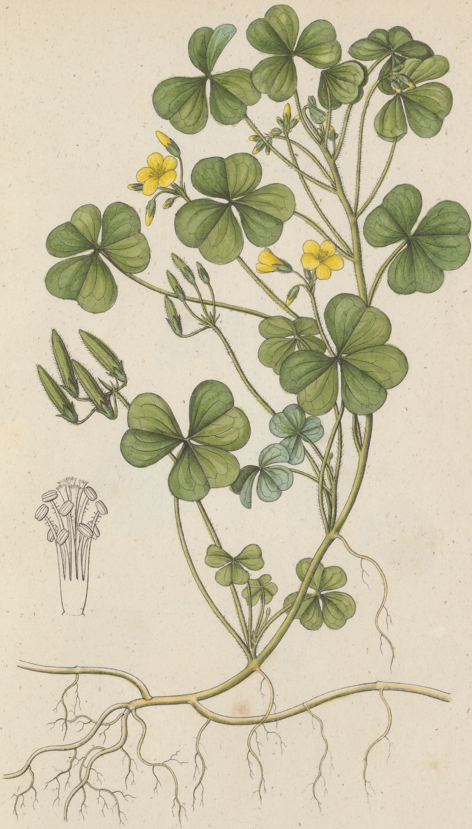
Oxalis corniculata Linne.