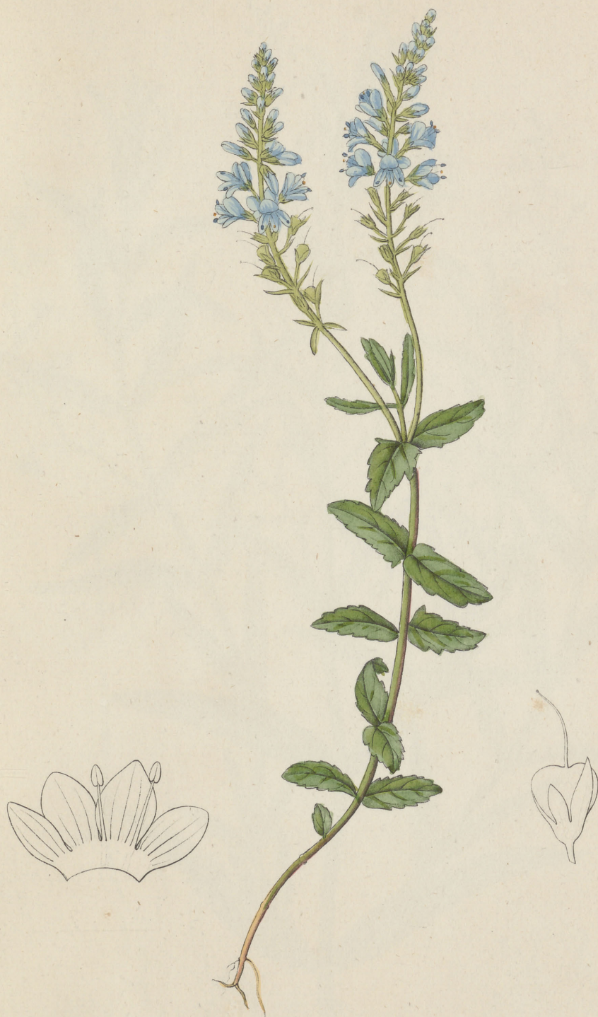
Veronica prostrata Linné.