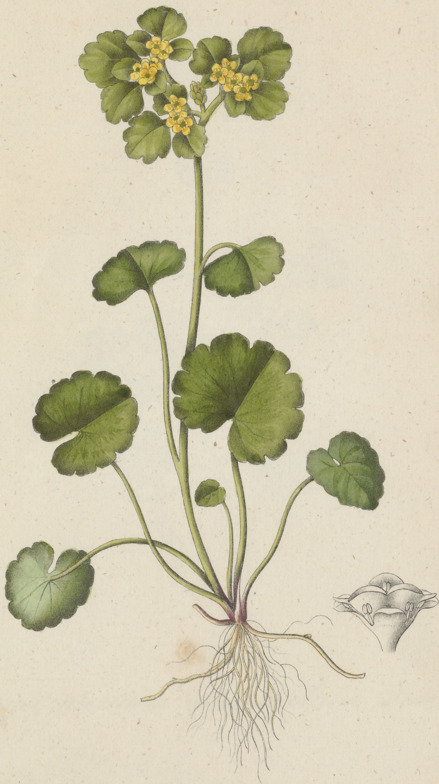
Chrysosplenium alternifolium Linné.