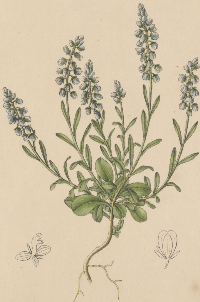
Polygala austriaca Crantz.