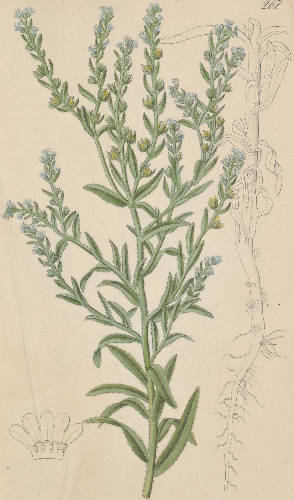
Echinosperrum Lappula Lehmann. Agalopsis L. C.