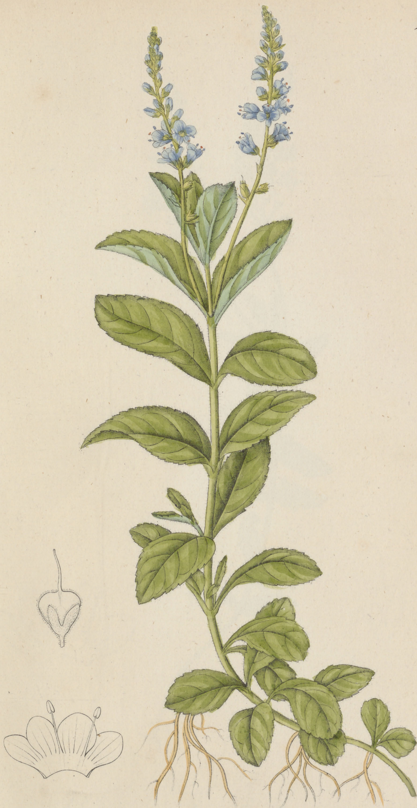
Veronica officinalis Linné.