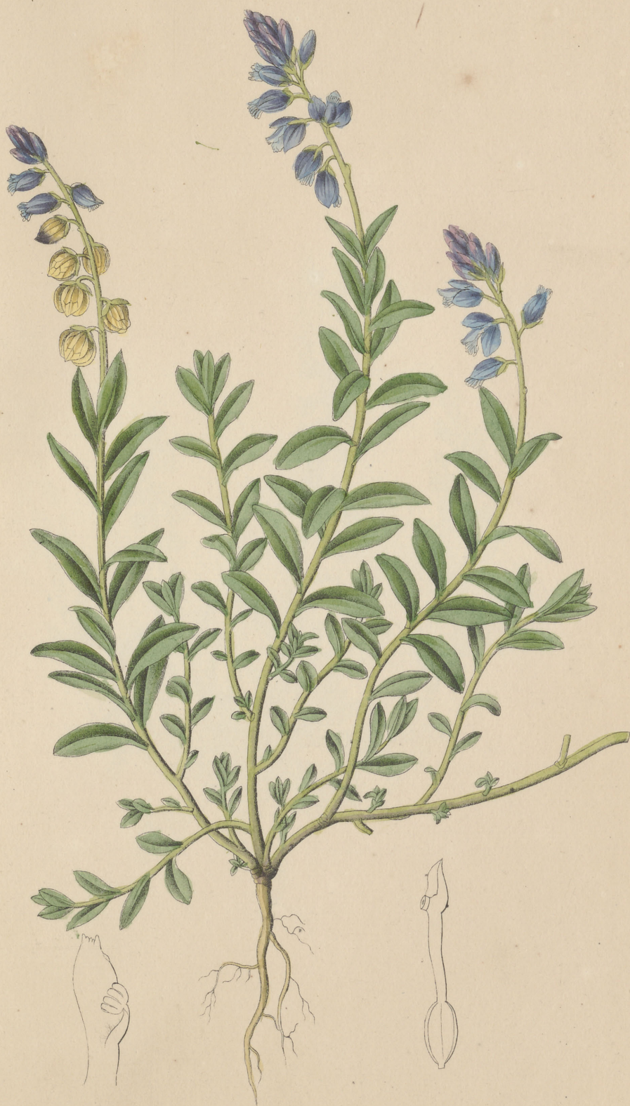
Polygala vulgaris Linné. femine breviflora. XVII L.