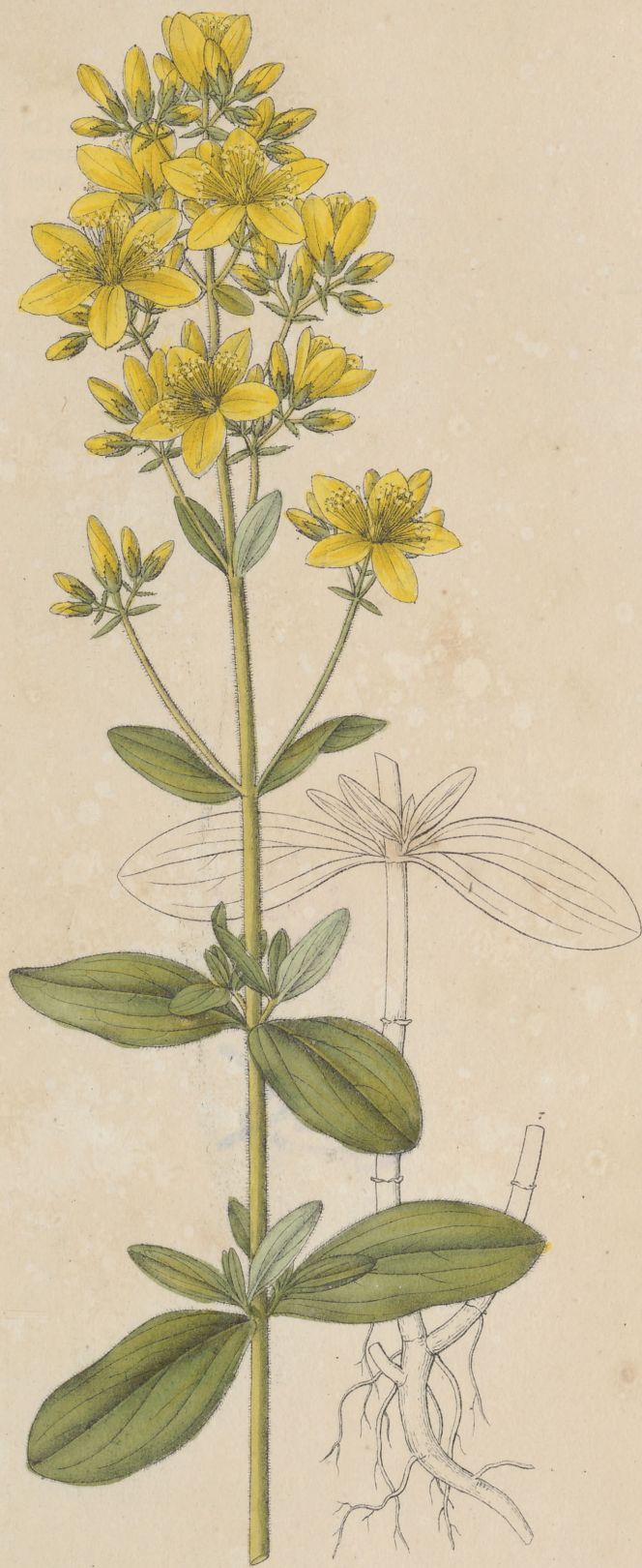
Hypericum hirsutum Linne.