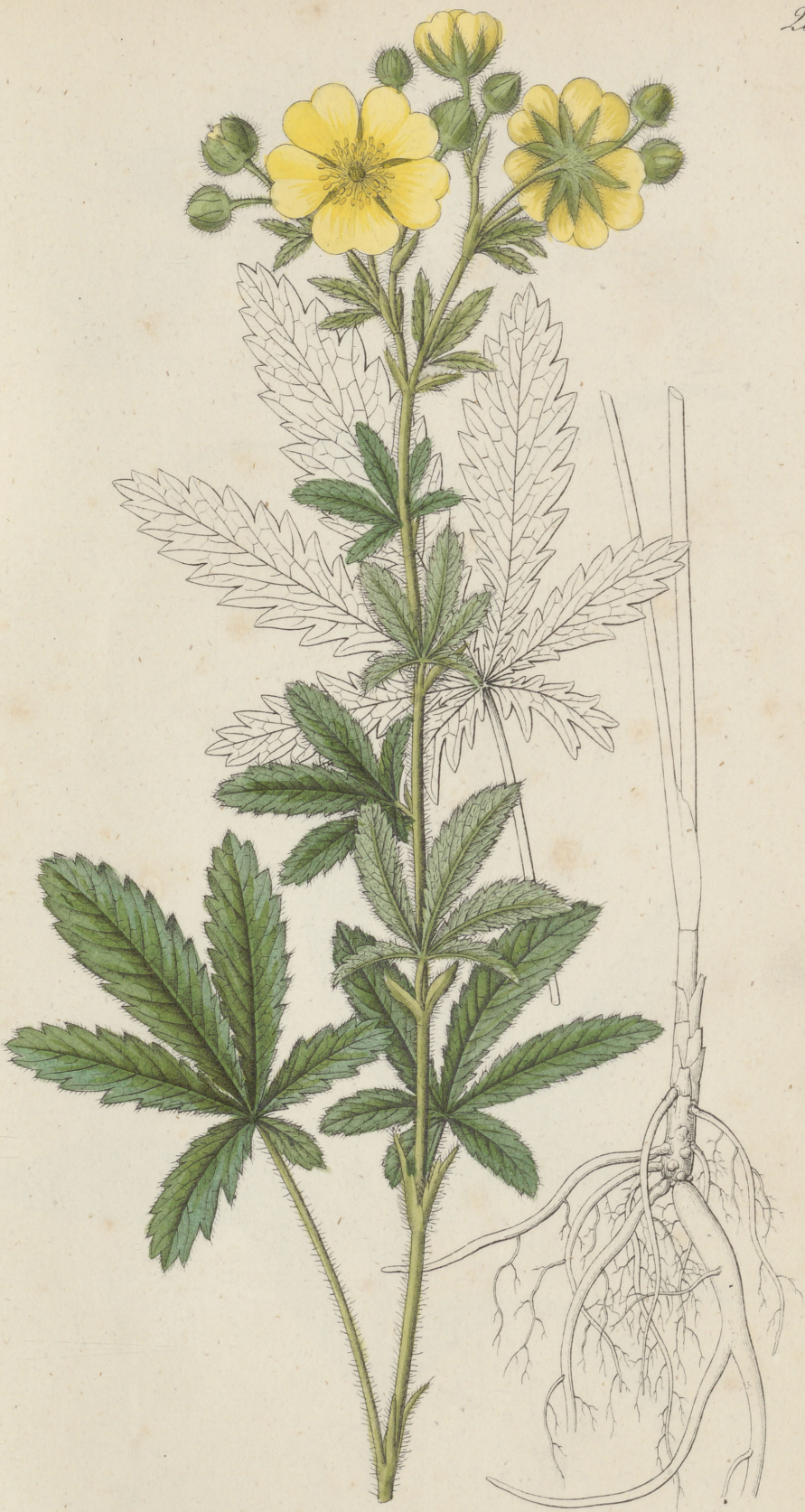
Potentilla recta Linne.