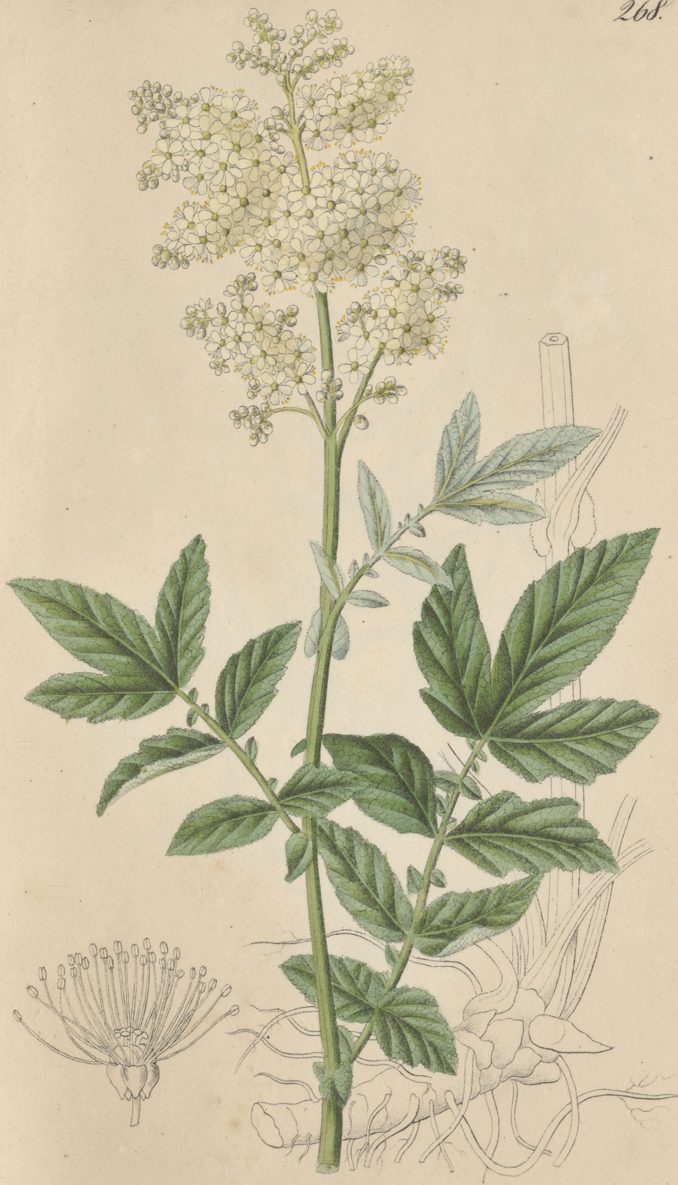
Spiraea Ulmaria Linné.