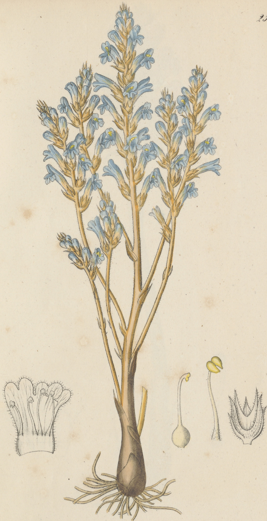
Orobanche ramosa Linné.