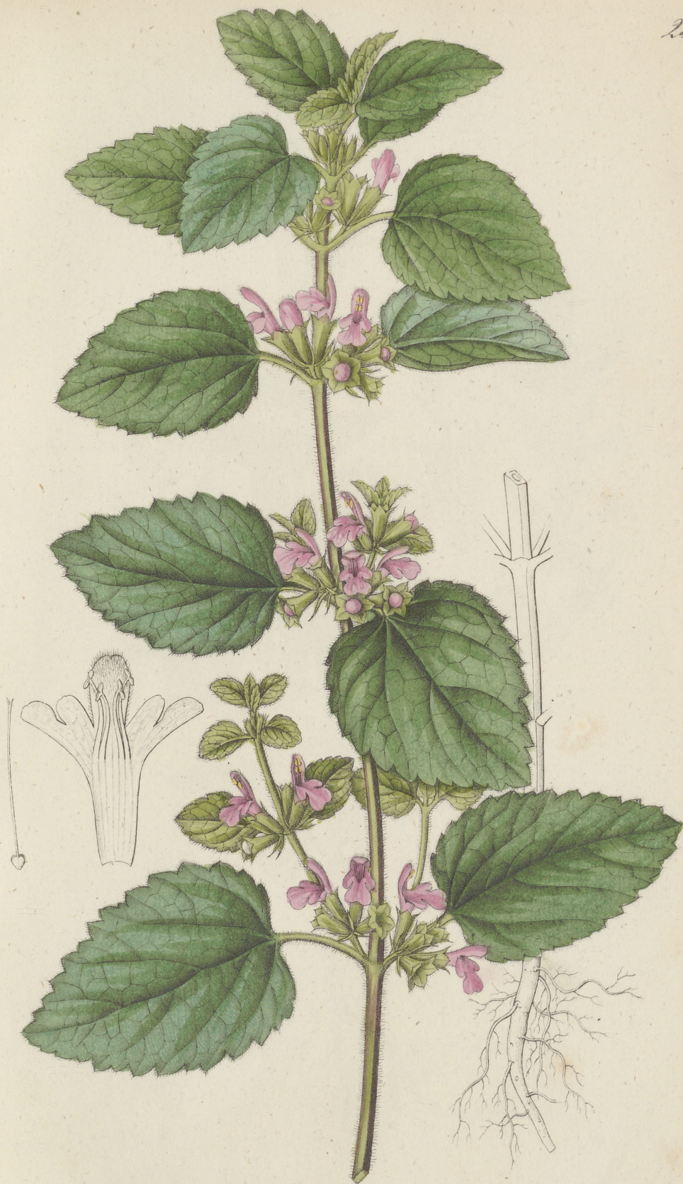
Ballota foetida Lamark.