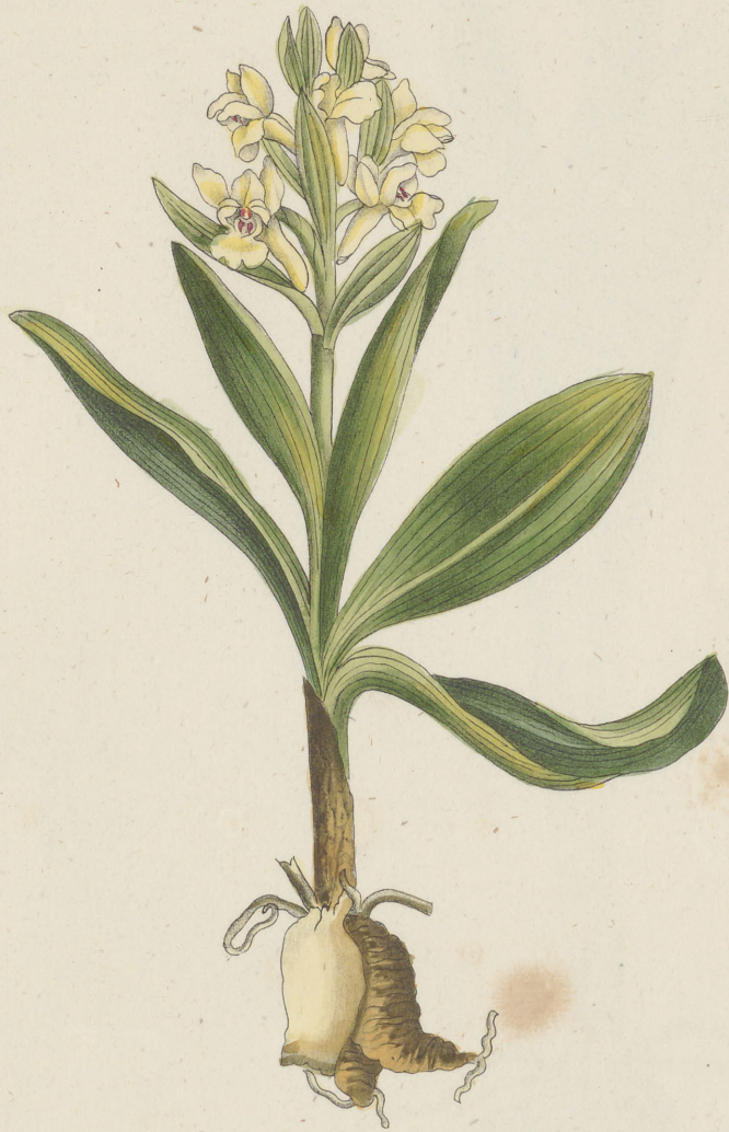
Cichis sambucina Linné