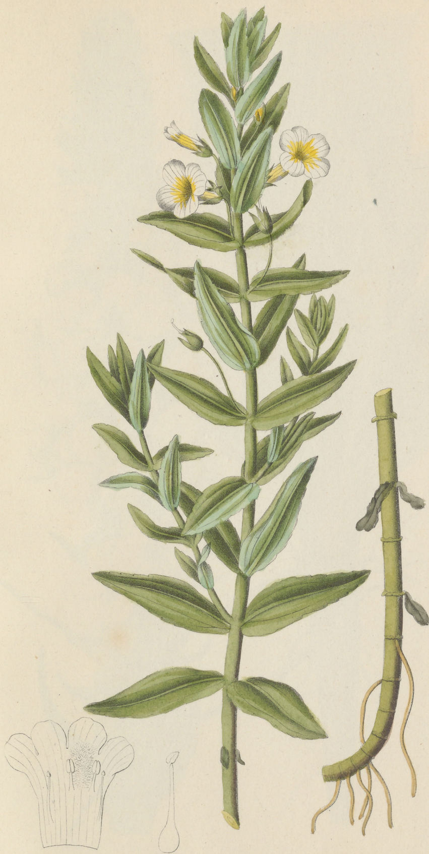
Gratiola officinalis Linné.