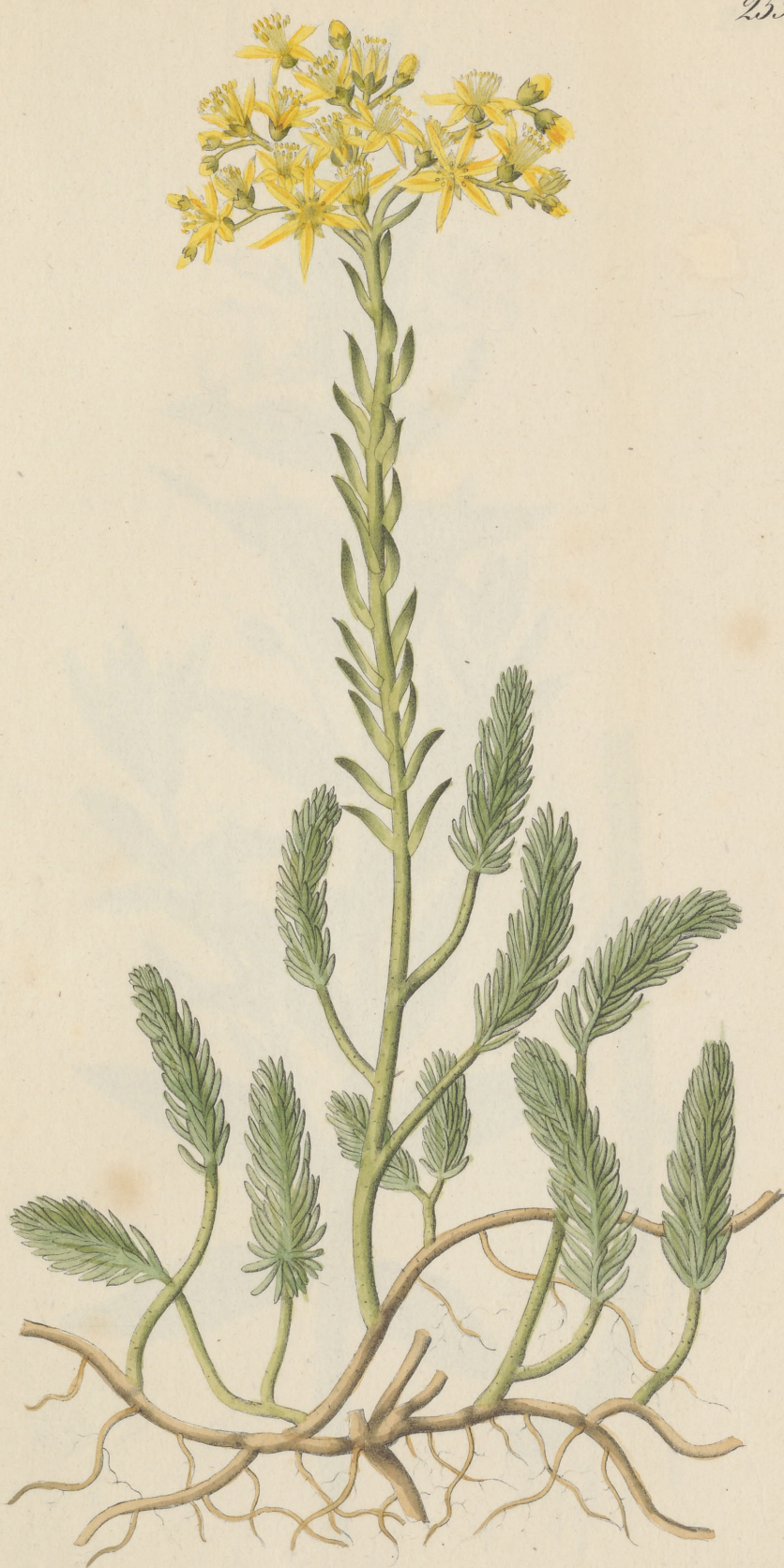
Sedum reflexum Linné.