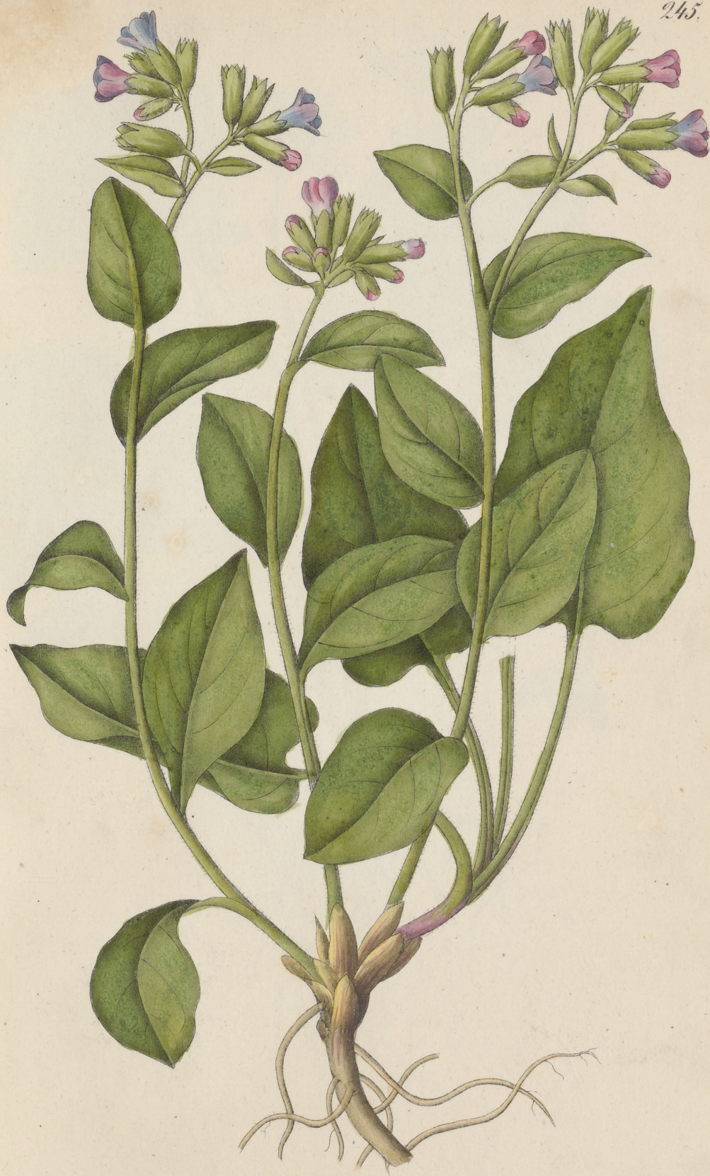
Pulmonaria officinalis Linné. Allegamboid. Pol.