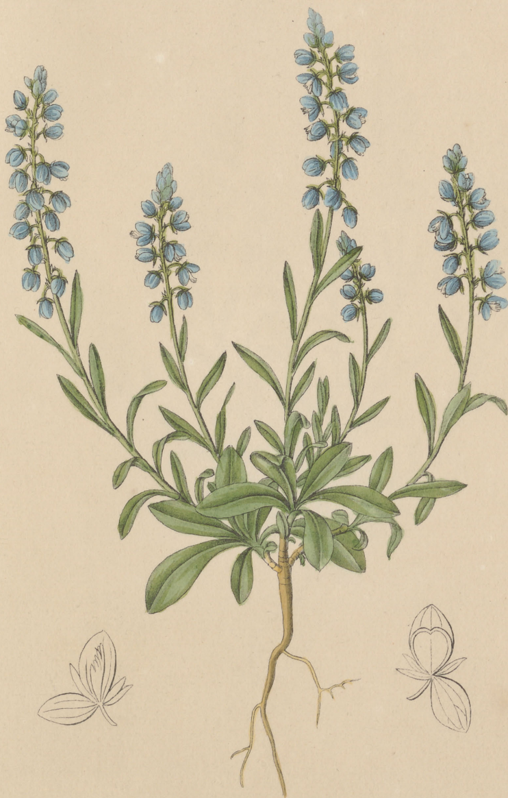
Polygala amara Linné. bittere Königblume VIII L.