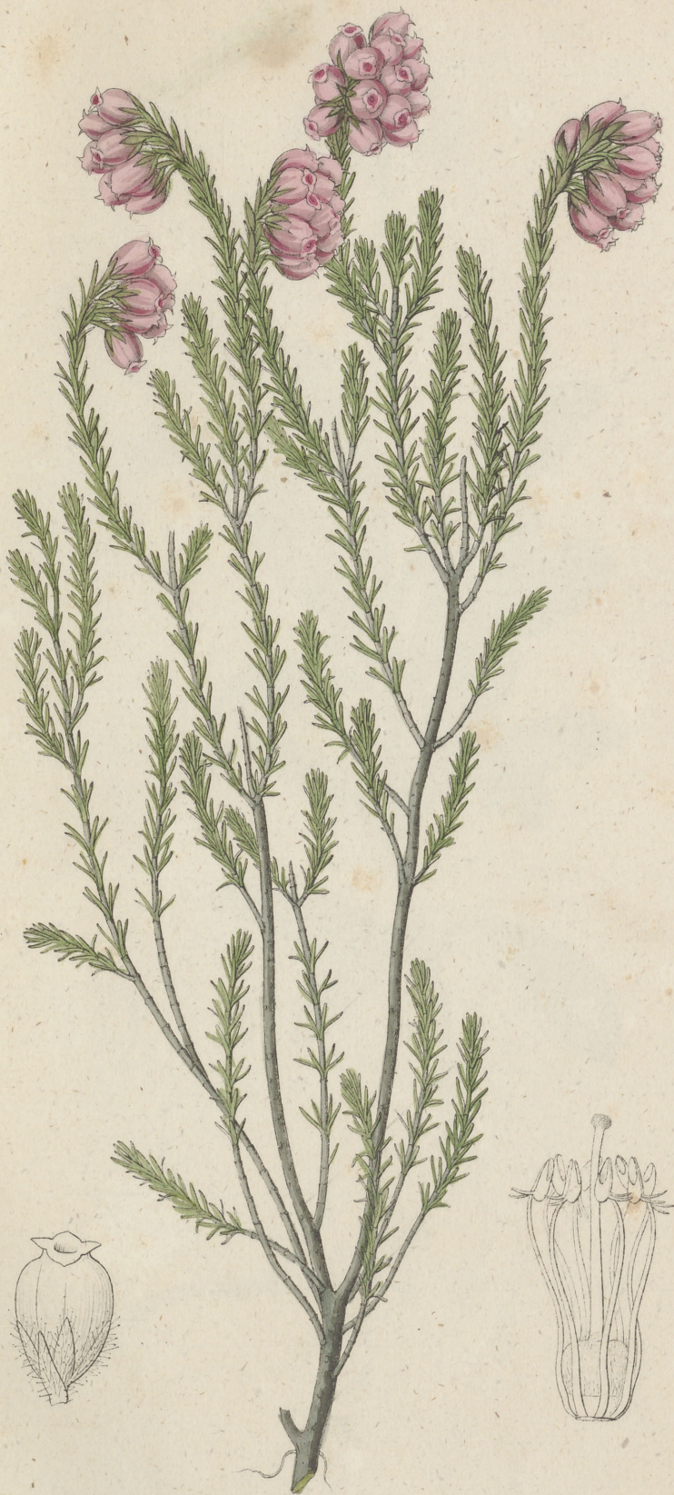
Erica Tetralix Linne.