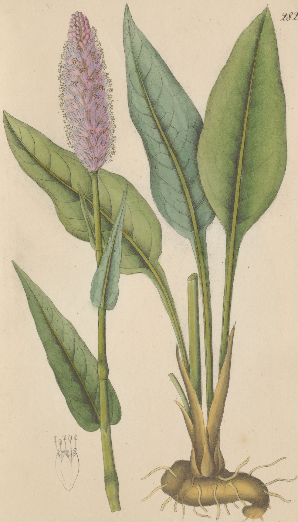
Polygonum Bistorta Linné.