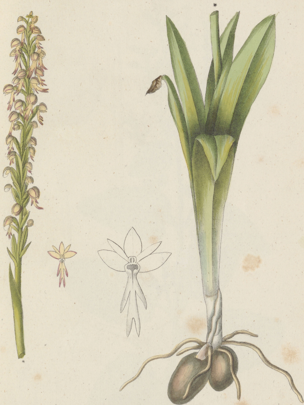
Acceras anthropophora Rob. Br.