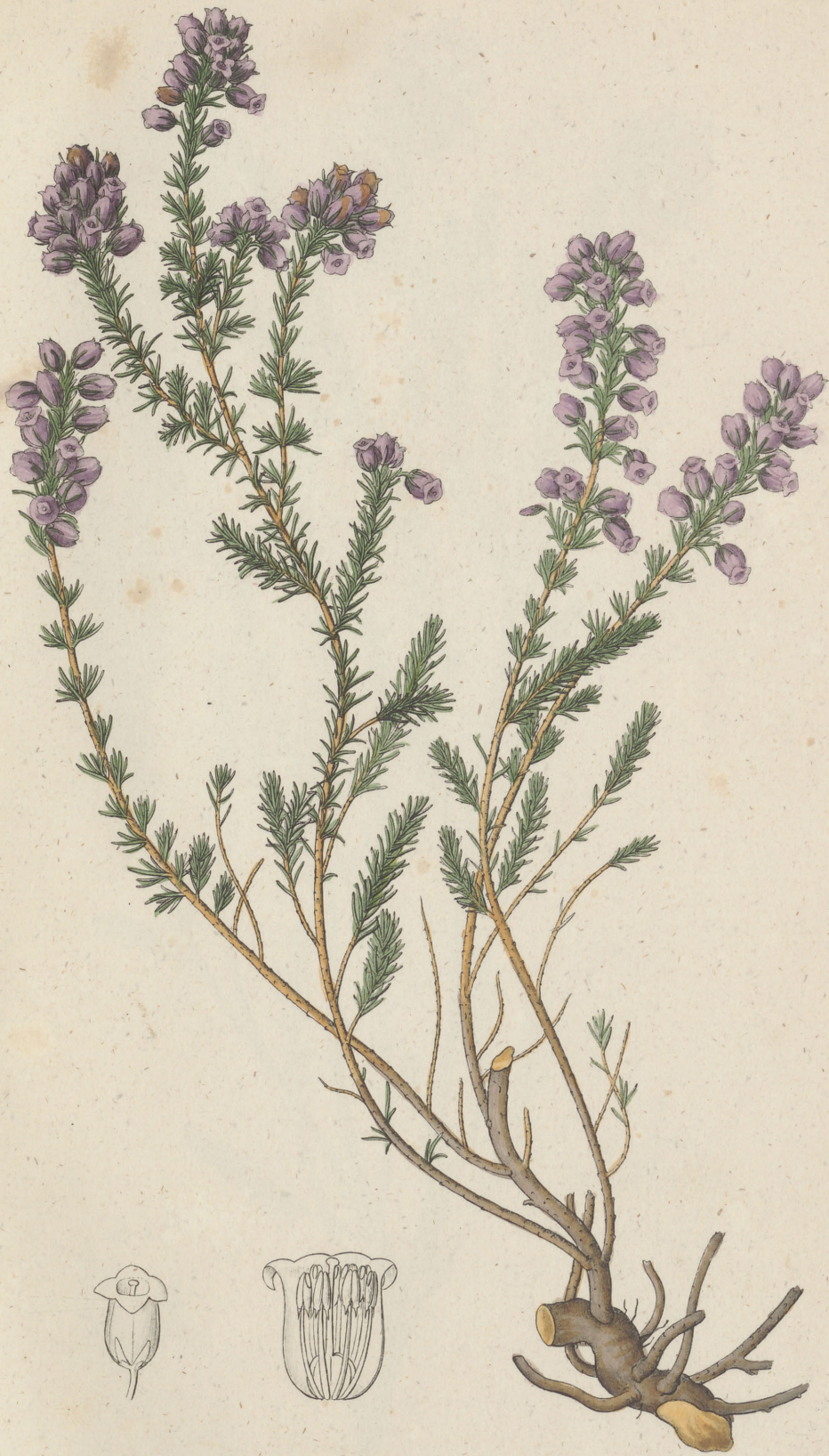
Erica cinerea Linné.