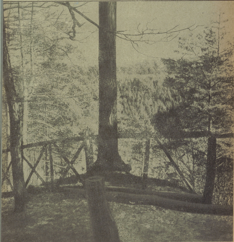
Elbing: Stadtwald Vogelsang, Blick von Weidmannsruh