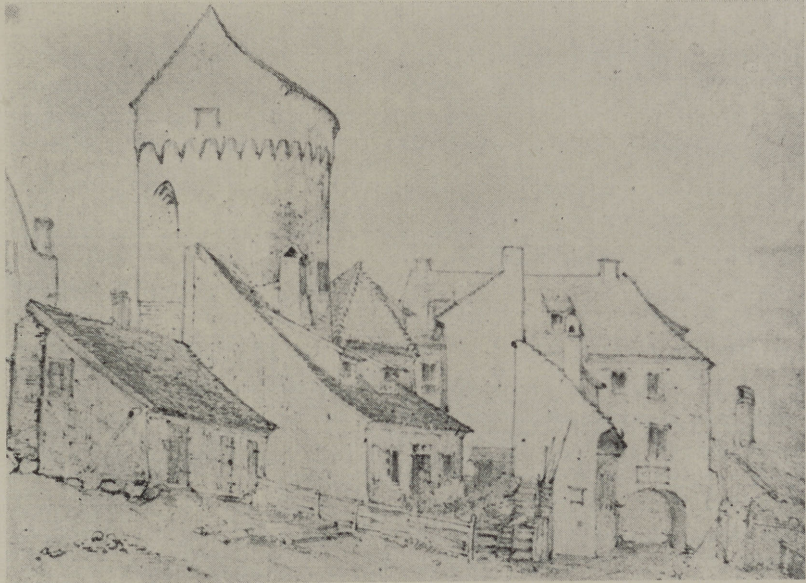
Waldemar Philippi: Bleistiftzeichnung vom Gelben Turm und Steindammer Dinghaus 1847