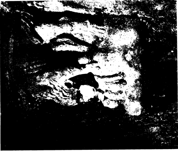
Abb. 2. Heilsberg, Bischofsstuhl, Rempertplastik.