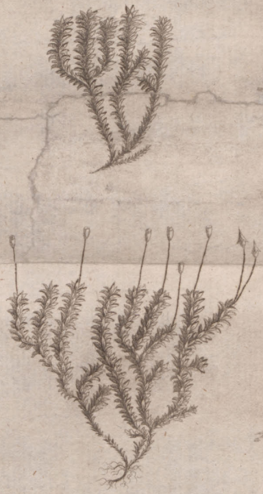
Bryum hypnoide erectum montanum erectis capitulis acutis.