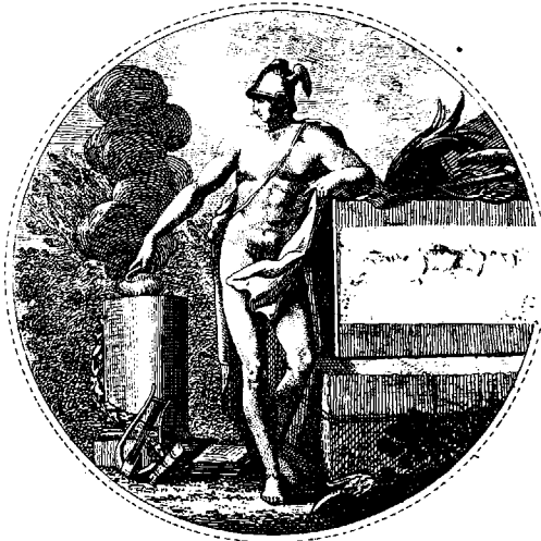
sc. J. Kneass inv. del. G. P. 1799