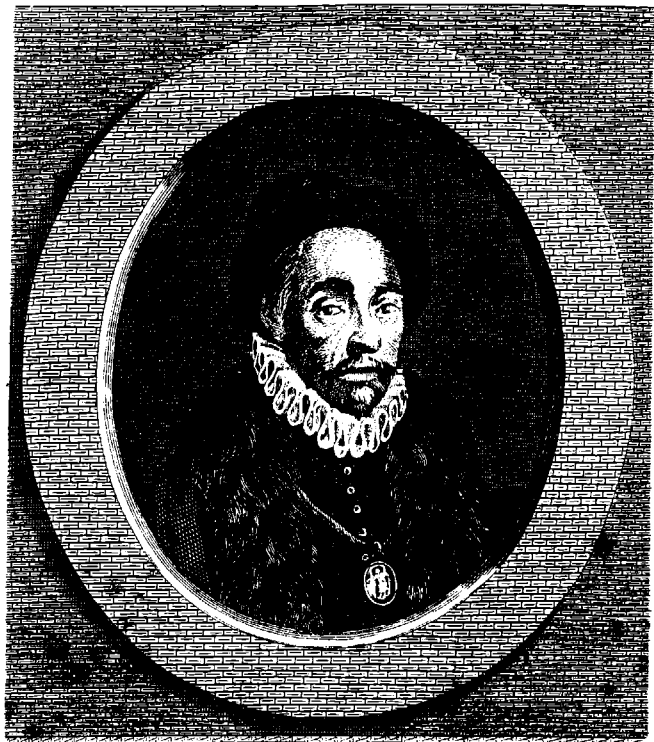
MICHEL DE MONTAIGNE,