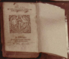
Opisana tutaj scena i postać człowieka, którego widzieliśmy na stronie poprzedniej z opisanymi przedmiotami i postą- kami. W 1808 roku. Pismo Antona Kordeczki. Drukarnia Kordeczki Wrocław / 1808.