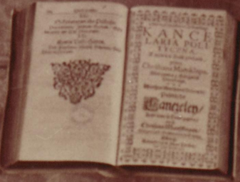
Strona tytułowa podręcznika językowi Mowa Słowacki złoty druk opracowany i wydany w dr- karni Antona Kordeczki Wrocław 1807 roku.