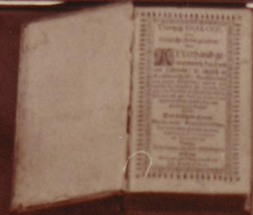
Strona tytułowa podręcznika M. Słowacki wydany w drukarni Antona Korde w 1807 roku. Podręcznik zawiera wykład w 12 rozdziałach, są omówione wyrazy i zdania potoczne.