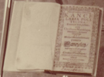
Strona tytułowa podręcznika językowi. Mowa Słowacki złoty druk polski opracowany wydany w dr- karni Antona Kordeczki w 1807 roku.