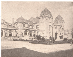
Teilbild des Kurhauses.

Von ihm ist in den Kreisen der Aerzte und ihrer Patienten viel die Rede. Neuenahr — im romanischen Ahrthale gelegen, dort am Eingang in die wilde Romantik des Eifelgebirges, dort, wo der Rhein, von den zackigen Kappen der „Sieben Berge“ scheidend, die Tiefebene betritt — ist zwar eine der jüngsten Blüten im reichen Kranze schmucker Bäder und Kurorte unseres Vaterlandes, trotzdem aber eine ihrer schönsten und blühendsten.