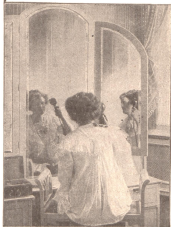
Elektr. Handmassageapparat im Gebrauch