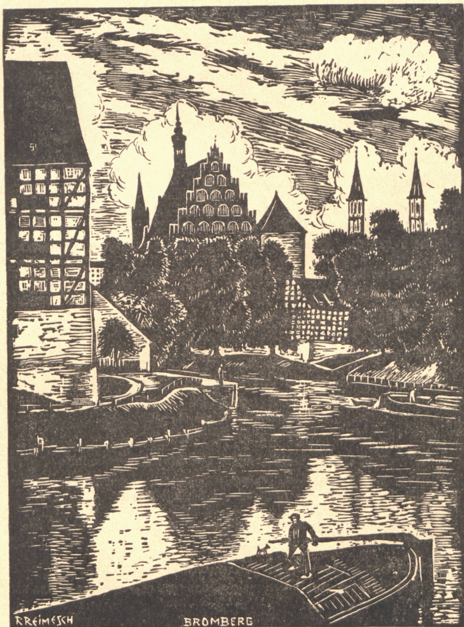
Bromberg Am Brahe-Kanal

Holzschnitt von Reginund Reimesch