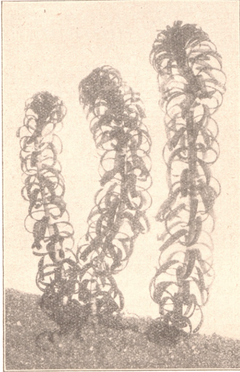
Elodea crispera .

zu werden, müssen dieselben im August, ehe sich die Dauerknospen bilden, von Kähen aus mit Rechen ausgeharkt werden. Bei den ablaßbaren Teichen genügt es, nach Trockenlegung den Boden mit Kalkmilch längere Zeit in Berührung zu lassen. In den Aquarien der Fischliebhaber ist die Wasserpest als bester Sauerstoffspender sehr geschätzt. Man hält außer der Elodea canadensis noch zwei Arten und