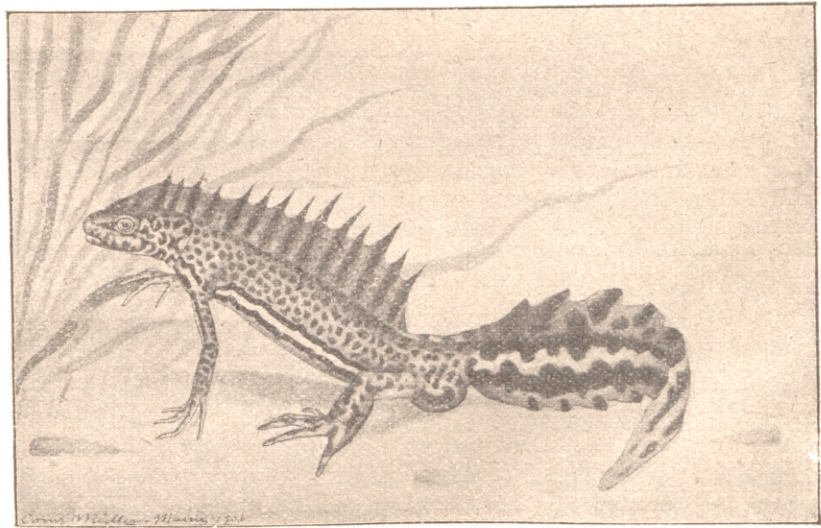
Bandmolch ( Triton vittatus ).

Ein großer Vorteil in der Molchpflege ist auch der, daß diese Tiere auch in sonnenlosen Zimmern gehalten werden können, und daß in der Winterzeit, wenn draußen in der Natur alles erstorben ist, im Molchaquarium das größte Leben