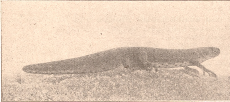
Grünlicher Wassermolch ( Diemictylus viridescens ).

Schlüpfen in ein kleines flaches Vollglasaquarium oder eine Schale; Petrischalen sind für diese Zwecke sehr gut geeignet. Als Bodenbelag wird eine Torfplatte, die vorher mäßig durchfeuchtet ist, in die Schale eingepreßt. Auf dieser feuchten Torfplatte können verschiedene Moosarten angesiedelt werden, die in der feuchten Luft bald den ganzen Boden überziehen. Einige Rindenstücke vervollständigen das Ganze; Deckscheibe wie bei den Molchaquarien mit Ausschnitt, der aber zur Vorsicht noch mit einem Stück durchlochten Blech