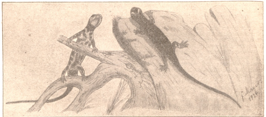
Brillensalamander ( Salamandrina perspicillata ).

mit der 5—6 cm lang hervorschnellenden Zunge weggeschossen. Das Terrarium kann für diese Arten etwas größer genommen und mit verschiedenen Blattpflanzen, Farnkräutern und Aesten ausgestattet werden. Die meisten Sp. fuscus gehen gewöhnlich während der heißen Sommerzeit ein, sind also recht kühl und schattig zu halten. Immerhin gelang es mir ein Stück der sardinischen Spielart mit seiner prächtigen wie mit grüner Bronze überstäubten Oberseite, seinerzeit von Marherr-Schmalkalden importiert, nahezu 2 Jahre am Leben zu erhalten. Diese Arten sind am Tage versteckt zwischen Stein- und Rindenspalten zu finden und kommen erst mit