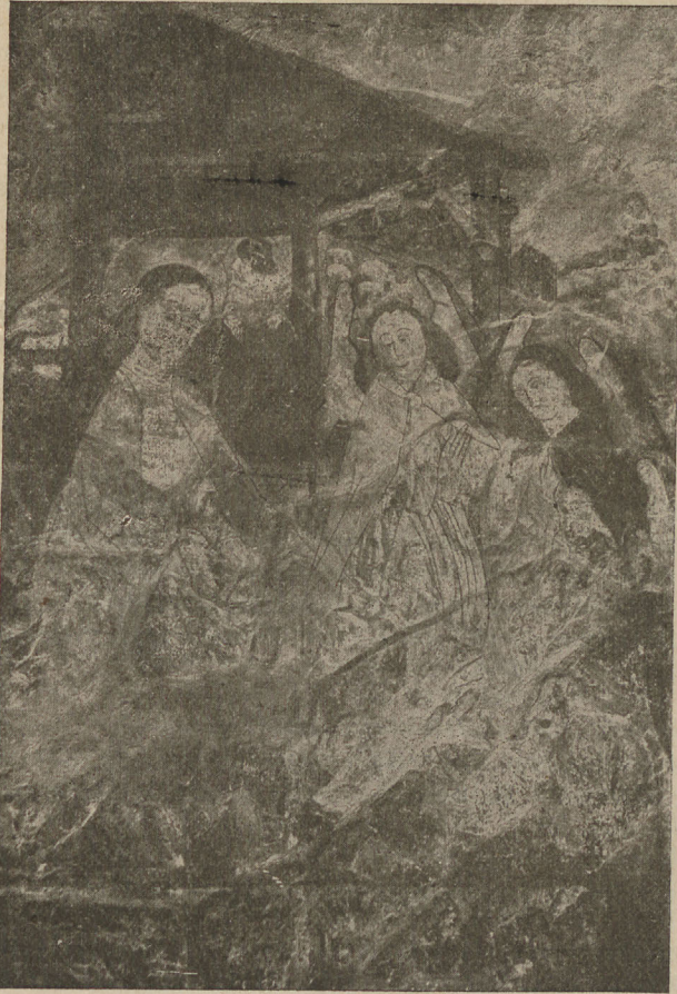
Abb. 1. Geburt Christi. Nürnberger Wandmalerei. Zustand nach der Abnahme. Um 1470.

Auf der Wiese rechts vom Stall weidende Schafe. Weiter nach rechts eine Stadt mit zinnenbekrönter Mauer und zwei Tortürmen sowie ein im rechten Winkel nach rechts abbiegender