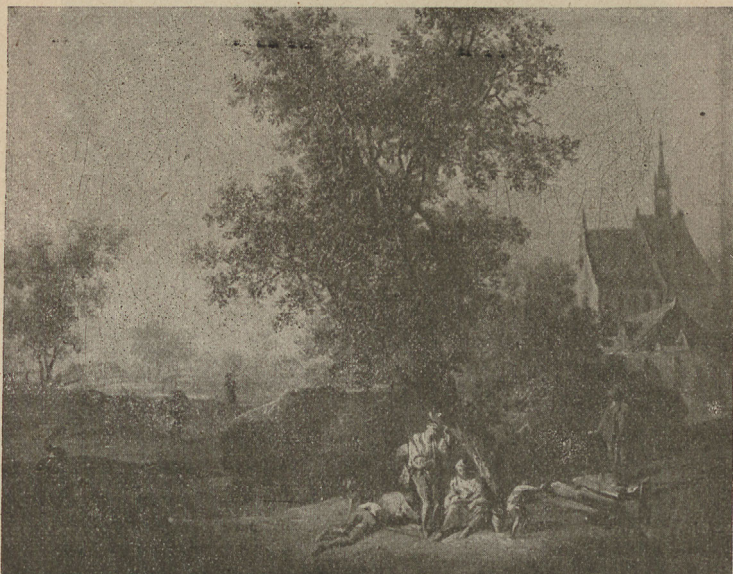
Abb. 3. Landschaft mit Bettlerfamilie. Oelbildchen von Joh. Konr. Seekatz. 1765.

geteilt haben, der Vergessenheit anheimzufallen, hätte ihm nicht Goethe in „Dichtung und Wahrheit“ ein bleibendes Denkmal gesetzt, und hätte sich die Goetheforschung nicht lange, ehe es die Kunstforschung tat, mit ihm beschäftigt. So blieb es erst Ludwig Bamberger im Jahre 1914 vorbehalten, eine kunstgeschichtliche Gesamtwürdigung des landgräfllich hessischen Hofmalers zu schreiben. Seekatz war aber auch kein Künstler von allzu großer Selbständigkeit. Eher ließe sich sagen, daß er auf dem besten Wege war, sich zu einer selbständigen Künstlerpersönlichkeit zu entwickeln, als ihn der Tod in eine andere Welt abberief. Seinen Ruf verdankt er seiner Einbeziehung in die Kindheit Goethes, der von den gemeinsamen Stunden in der Giebelstube am Hirschgraben erzählt, bei deren Erinnerung er den verstorbenen Meister mit Stolz seinen „Freund“ nennt. So ist es mehr das kulturgeschichtliche Milieu unseres Museums, das mit dem Bildchen eine Bereicherung erfährt, während gleichzeitig das Werk des Meisters in ihm durch eine weitere datierte Arbeit ergänzt wird.