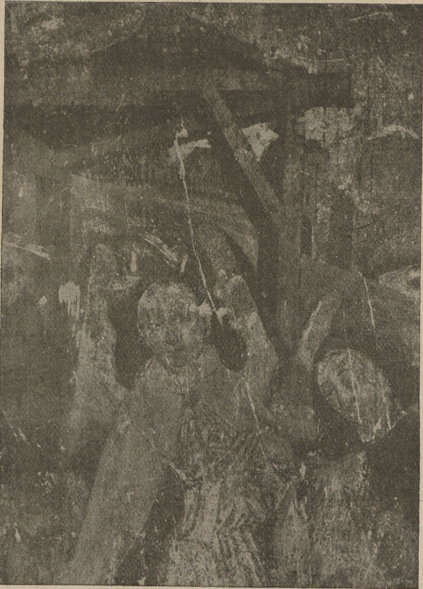
Abb. 2. Geburt Christi. Nürnberger Wandmalerei. Detail. Aufnahme vor der Abnahme. Um 1470.

Was seine kunstgeschichtliche Stellung betrifft, so haben wir es mit einem Künstler zu tun, welcher den vom Meister der Sebald- Epitaphien mit dem Imhoff-Voldkamer-Epitaph (um 1438) geschaffenen Kompositionstyp – allerdings in derberer Form – fortsetzt, der also auf der heimischen Tradition aufbaut. Aber der darstellungsmäßige Vorgang ist bereits in eine Landschaft eingestellt, und diese nimmt auf dem Bilde einen sehr breiten Raum ein. Auffallend ist das genrehafte Motiv des kleinen galoppierenden Reiters. Die Landschaft ist breit und flächig behandelt. Der Vorgang selbst trägt einen leichten Hauch des idyllischen Zaubers,