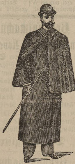
Herren-Havelocks mit voller Pellerine von 15 bis 40 M.