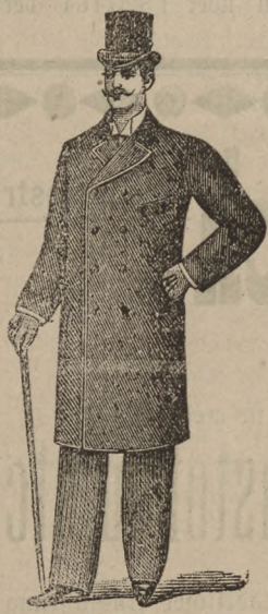
Winter-Paletots in Eskimo und Krimmer von 12 bis 35 M.