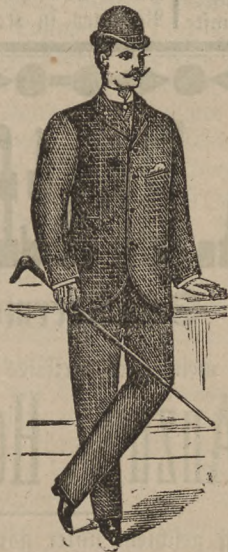
Jacket-Anzüge in Cheviot und Kammgarn von 13 bis 36 M.