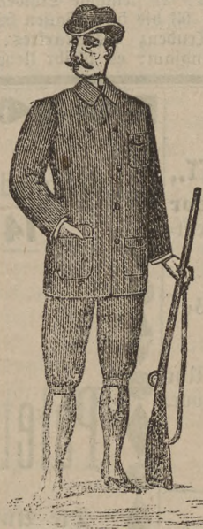
Jagd-Joppen in Velour und Loden von 7 bis 18 M.