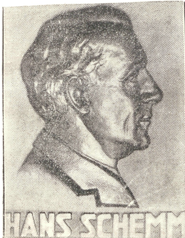
Die Hans-Schemm- Erinnerungsplakette Alexisbad